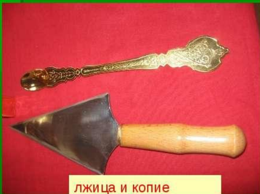
ЛЖИЦА И КОПИЕ