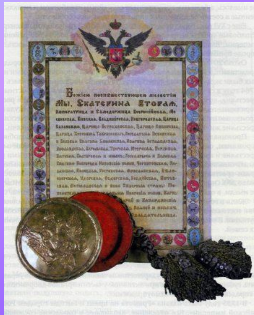
"Жалованная грамота дворянству", подписанная Екатериной II в 1785 году.