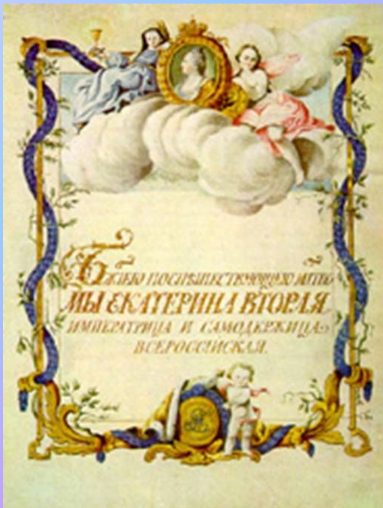
Титульный лист жалованной грамоты Екатерины II