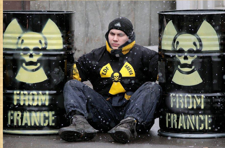
Протест против ввоза радиоактивных отходов