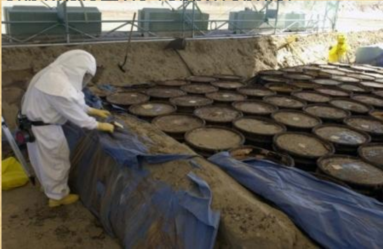
Город – радиоактивная свалка в США

Идет разработка новых способов вторичного использования отработанного ядерного топлива. Использовать радиацию максимально эффективно, использовав то, что так трудно изолировать и захоронить, - вот задача настоящего и будущего! Жизненно необходимы новые технологии регулирования ядерных процессов. Очень привлекательно выглядит идея получения энергии из уже имеющихся радиоактивных отходов, экологическая перестройка атомной промышленности в сторону повышения её эффективности и минимизации отходов.. Поистине революционной может показаться идея разумного применения тех ядерных свалок и захоронений, которые сейчас занимают значительные пространства планеты и излучают радиацию, отравляя окружающую территорию.