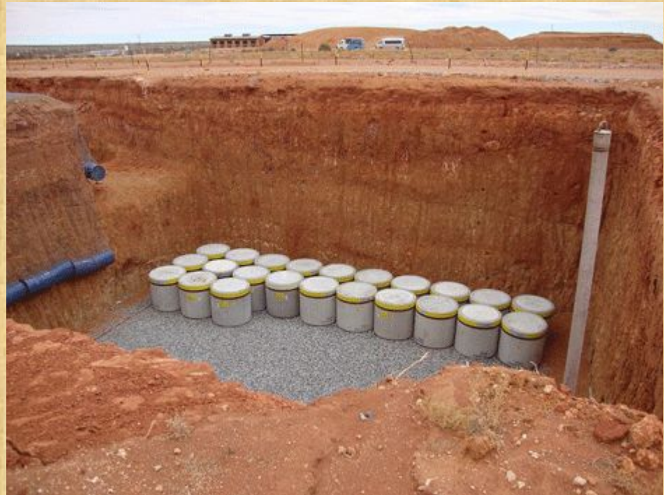
Захоронение радиоактивных отходов в Африке

Рассматривались варианты: захоронить РАО в глубоких океанических впадинах, в донных осадках океанов, в полярных шапках; отправлять их в космос; закладывать их в глубокие слои земной коры.