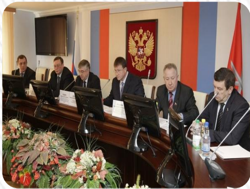
Засідання урядів Франції та Росії

У Франції встановлена основним законом організація виконавчої влади і існуюча практика зумовили перетворення президента на реального главу уряду.