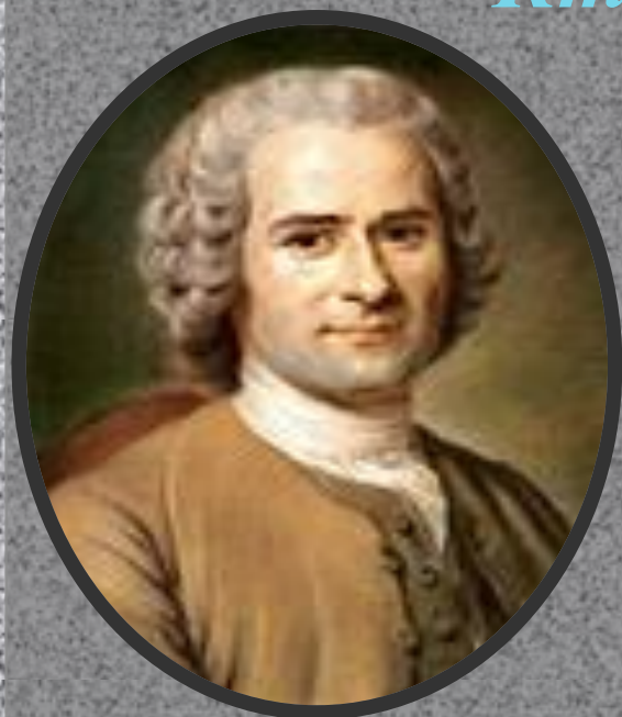
Жан Жак Руссо