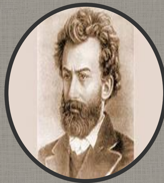
Николай Миклухо - Маклай