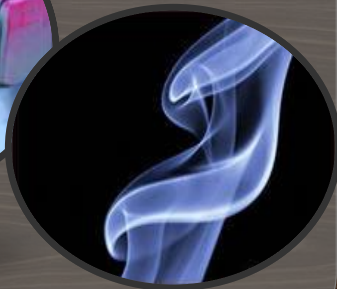
Дым от сигареты