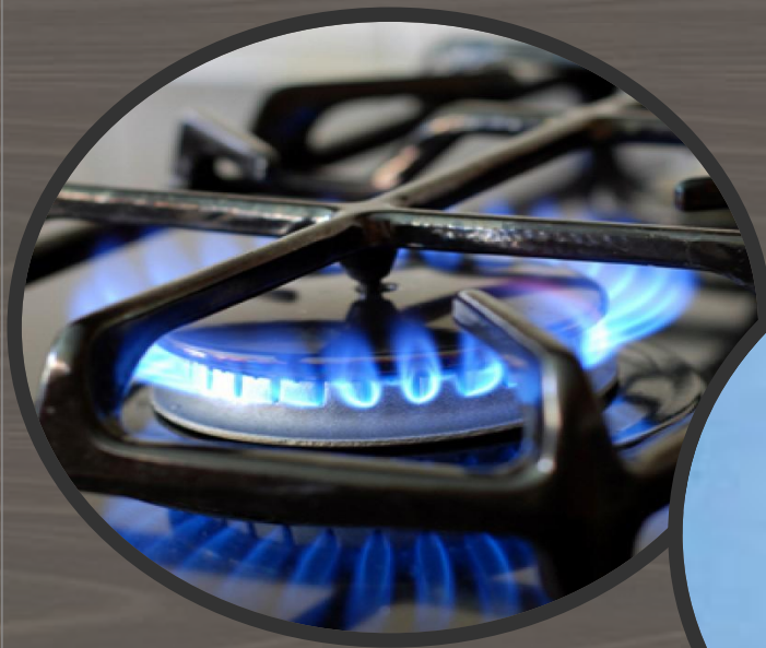
Дым от газовой горелки