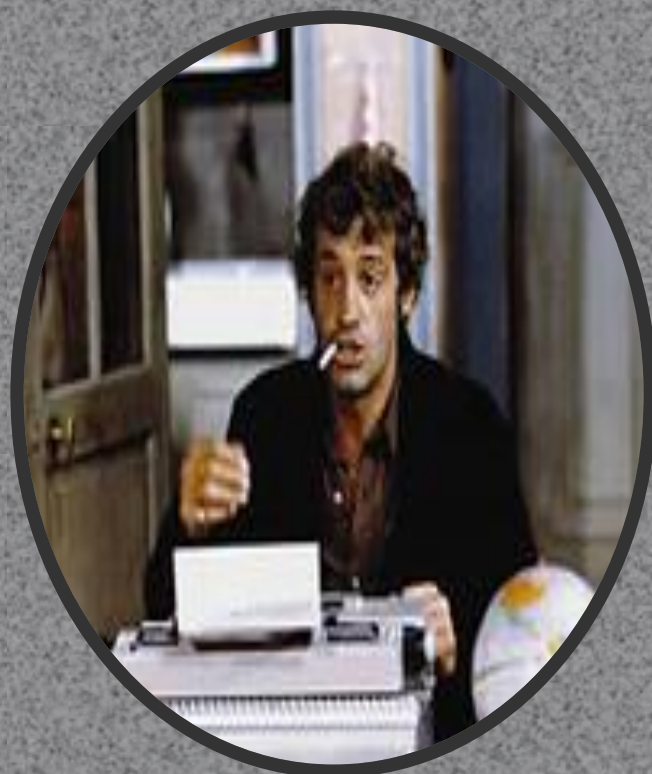
Жан Поль Бельмондо