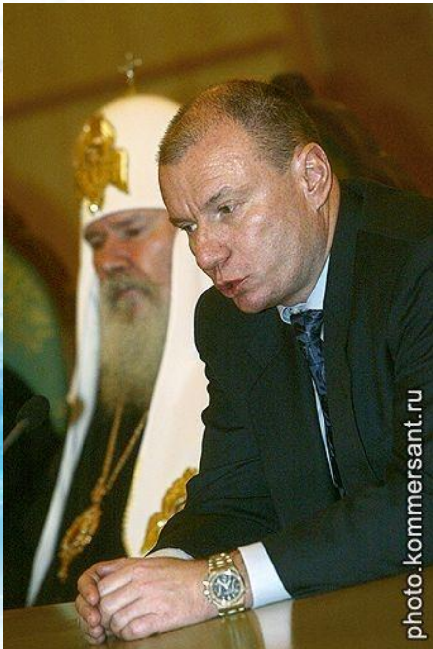
Владимир Потанин и патриарх Алексей II