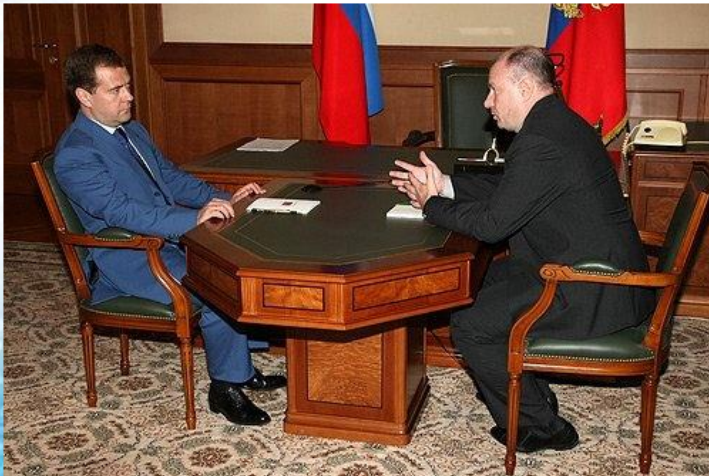
Владимир Путин и Дмитрий Медведев