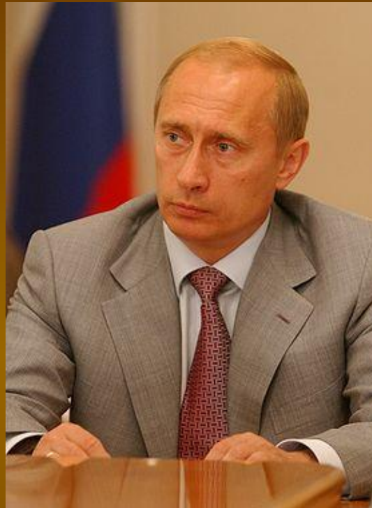
Владимир Владимирович Путин

Избирался Президентом два раза (12 июня 1991 – 31 декабря 1999 г)