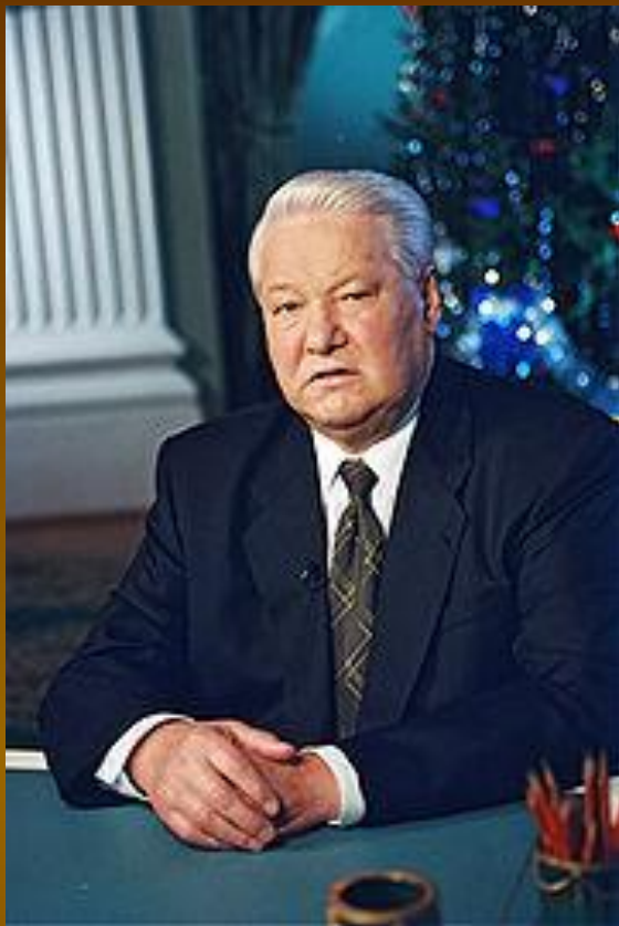
Борис Николаевич Ельцин

Избирался Президентом два раза (12 июня 1991 – 31 декабря 1999 г)