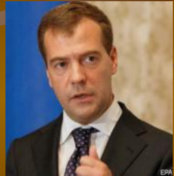
Медведев Дмитрий Анатольевич

Третий Президент Российской Федерации (2 марта 2008 по н. время)