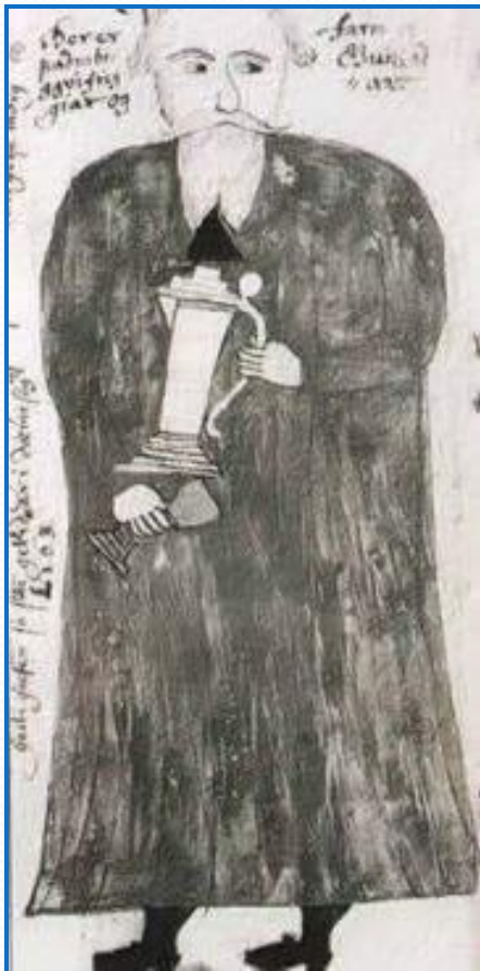
Квасир на средневековой гравюре

Деревни или села имели свой питейный дом или корчму, где подавали пиво, брагу, меды, квасы.