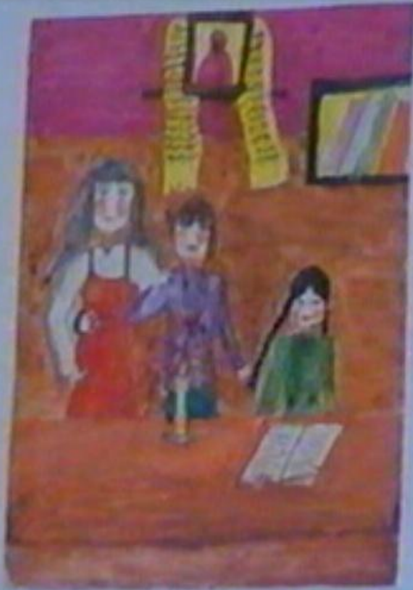
ЖЕНЩИНЫ НА ПРАЗДНИКЕ