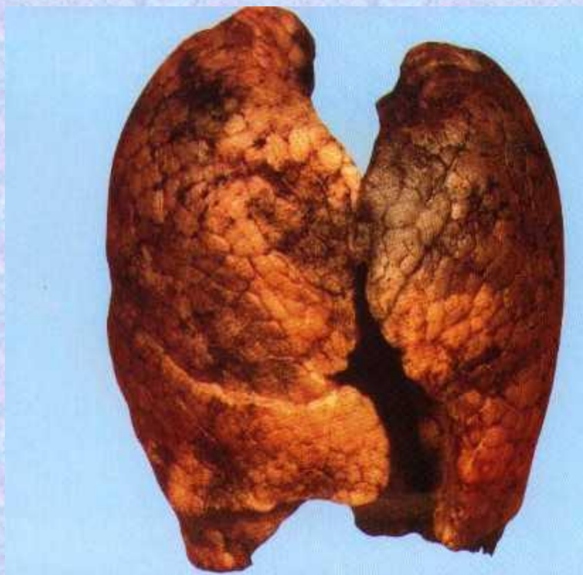
Лёгкие курящего человека