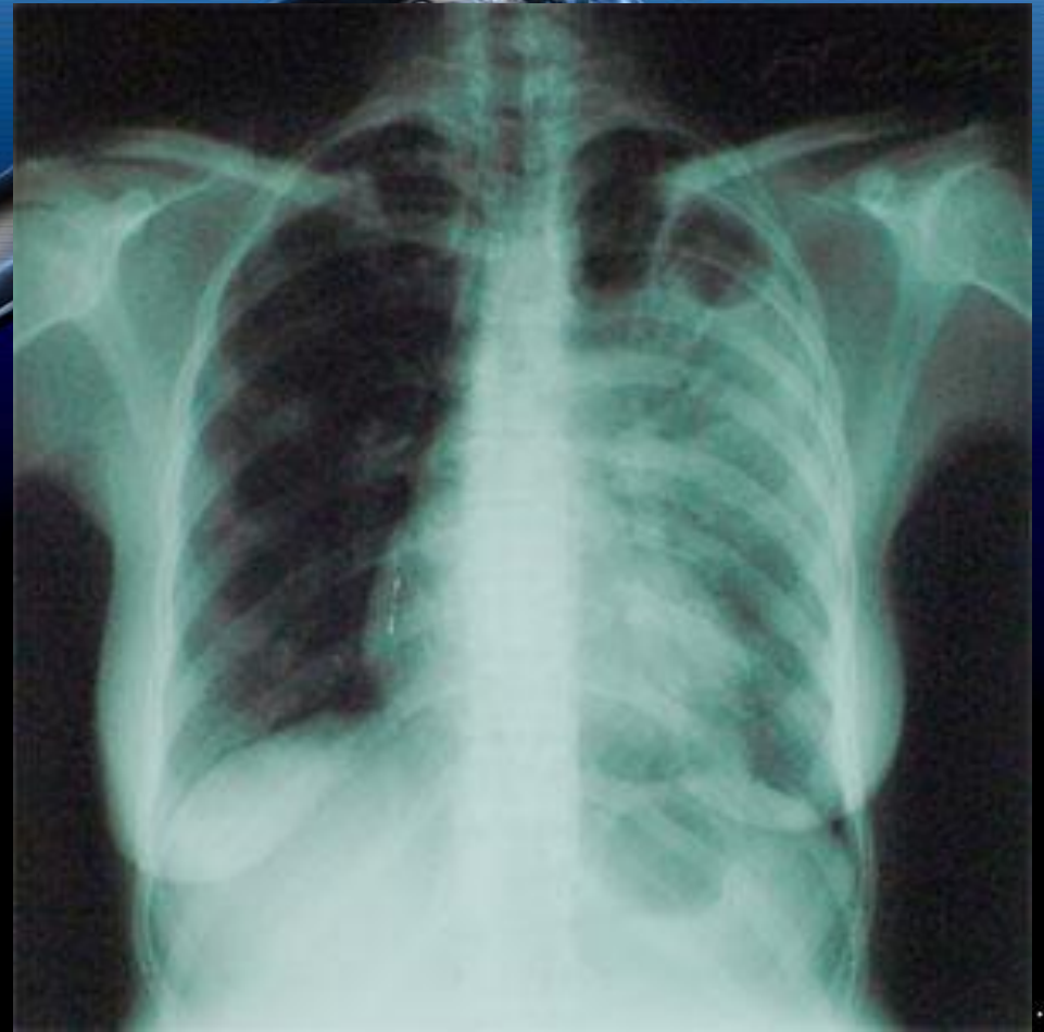
Легкие человека, болеющего туберкулёзом