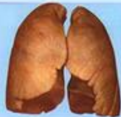
Лёгкие человека некурящего