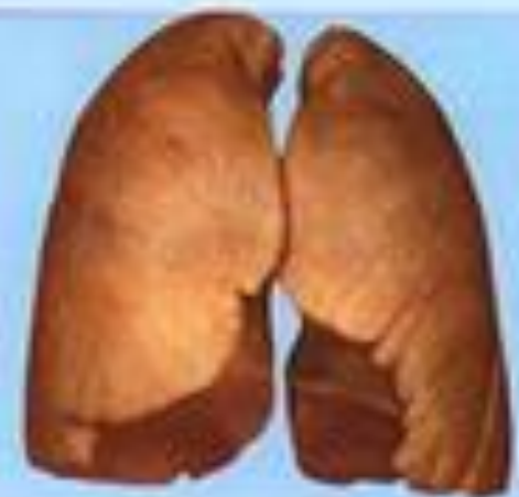
Лёгкие человека некурящего