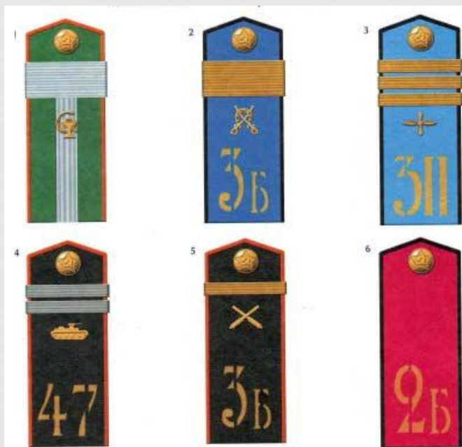
Погоны младшего командного и рядового состава (1943 г.):