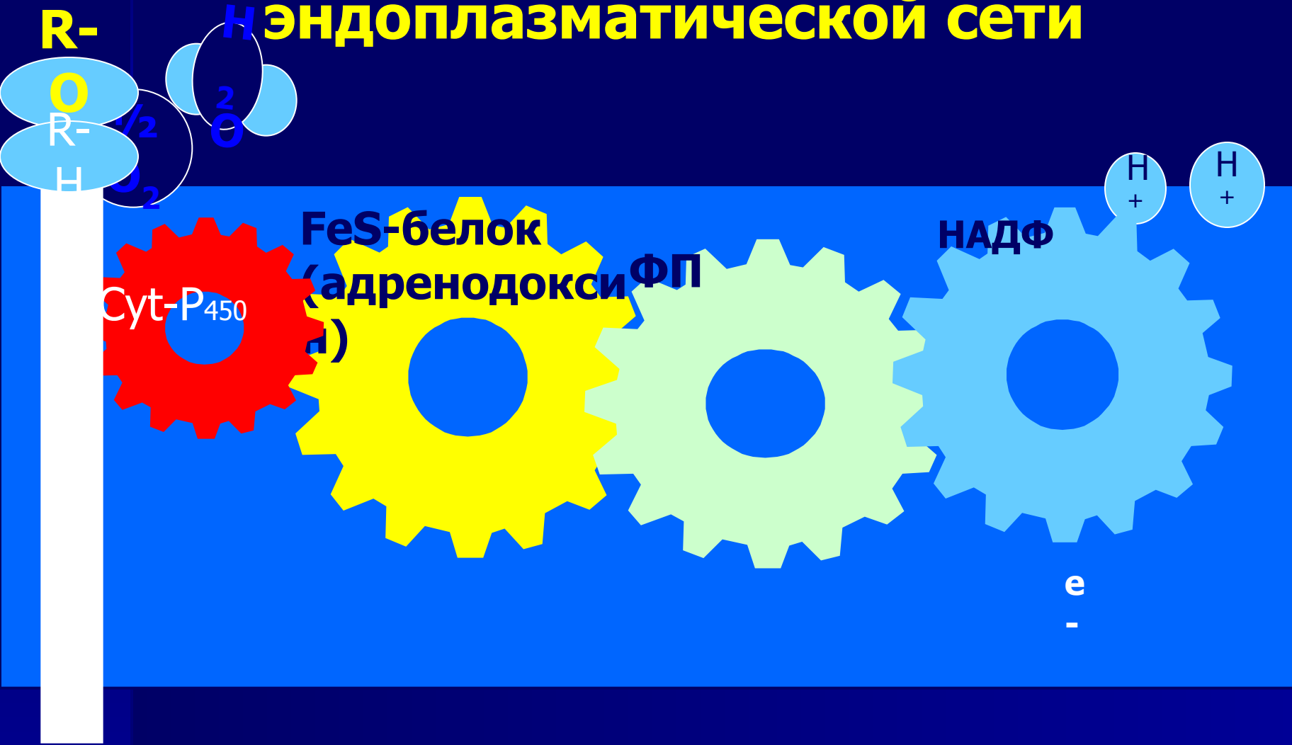
Схема работы ферментов гладкой эндоплазматической сети