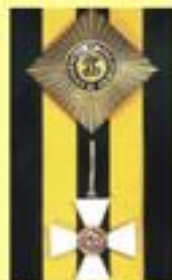
Орден Святого Георгия (звезда и знак I степени)