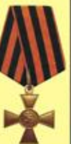
Знак отличия - Георгиевский Крест I степени