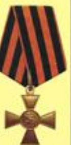
Знак отличия - Георгиевский Крест I степени