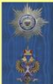
Орден Святого апостола Андрея Первозванного (звезда и знак)