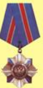
Орден "За военные заслуги"