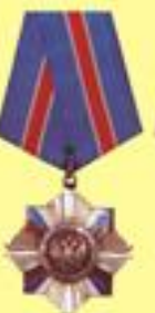
Орден "За военные заслуги"