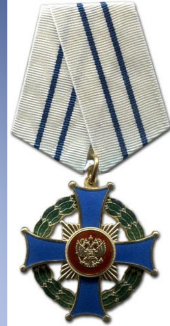
Орден «Родительская слава». Основания награждения - воспитавшим семерых и более детей

Всего в период существования Советского Союза было учреждено 20 орденов и 54 медали.