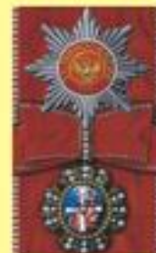
Орден Святой Великомученицы Екатерины (звезда и знак)