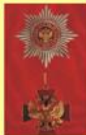
Орден "За заслуги перед Отечеством" (звезда и знак I степени)