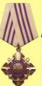
Орден "За морские заслуги"