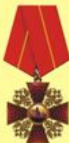
Орден Александра Невского