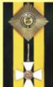
Орден Святого Георгия (звезда и знак I степени)