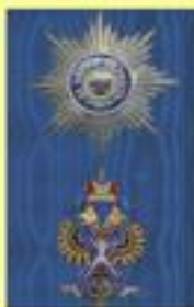
Орден Святого апостола Андрея Первозванного (звезда и знак)