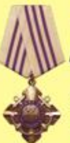
Орден "За морские заслуги"