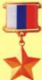
Знак особого отличия - медаль "Золотая Звезда" Героя России