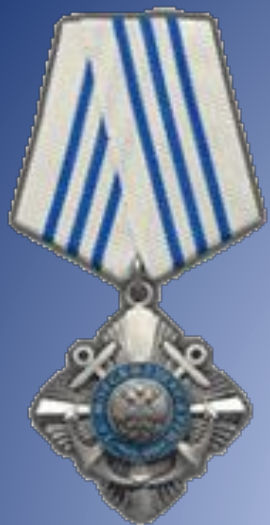
Орден «За морские заслуги»