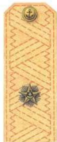
Контр-адмирал (повседневная форма одежды)