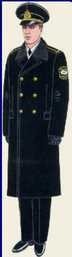
парадная для строя и вне строя