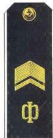
Главный корабельный старшина