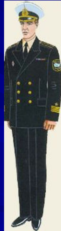
повседневная вне строя