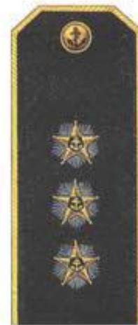
Адмирал (повседневная форма одежды)