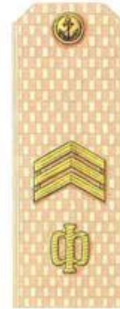
Старшина 1 статьи