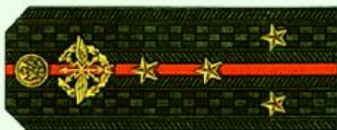
Капитан (повседневная форма одежды)