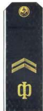
Старшина 2 статьи