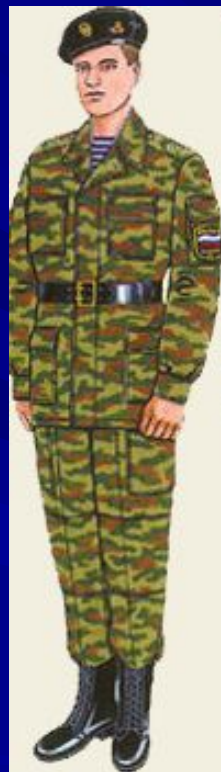
повседневная для строя и вне строя