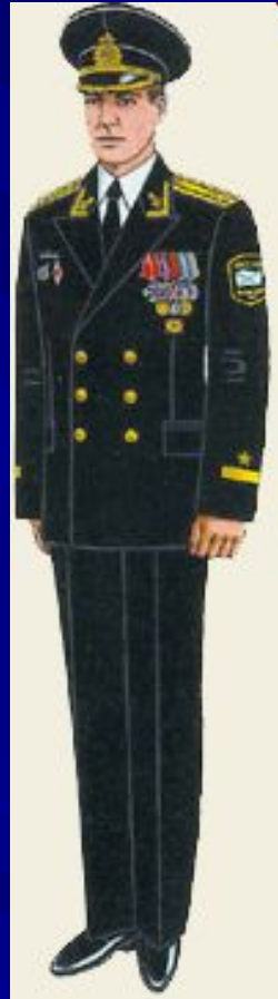
парадная для строя и вне строя