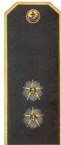
Вице-адмирал (повседневная форма одежды)