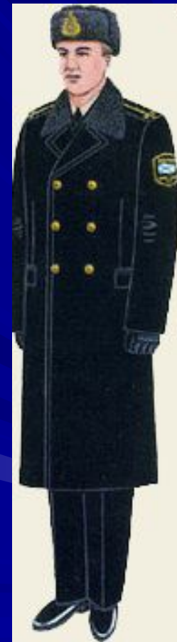
повседневная для строя и вне строя