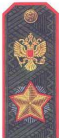
Маршал Российской Федерации (повседневная форма одежды)