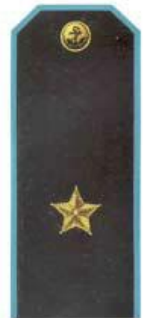
Генерал-майор (повседневная форма одежды, морская авиация)