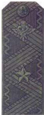
Генерал-майор (полевая форма одежды)