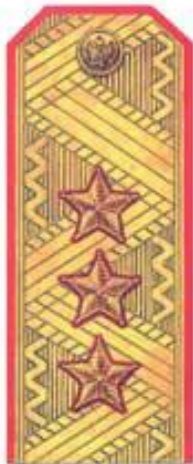
Генерал-полковник (парадная форма одежды)