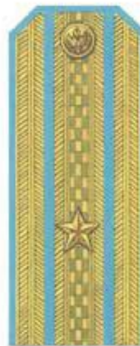
Майор (парадная форма одежды, ВВС, ВДВ)