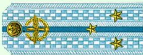
Старший лейтенант (парадная форма одежды, ВВС)