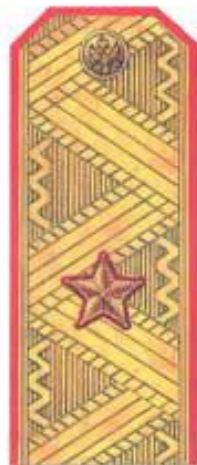
Генерал-майор (парадная форма одежды)