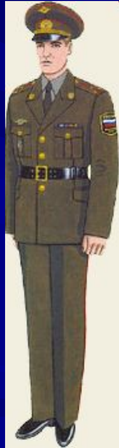
Повседневная для строя