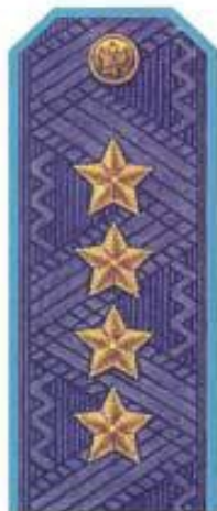
Генерал армии (повседневная форма одежды, ВВС)