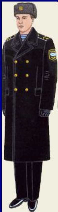
парадная вне строя