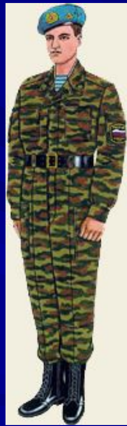
парадная для строя повседневная и вне строя ВДВ