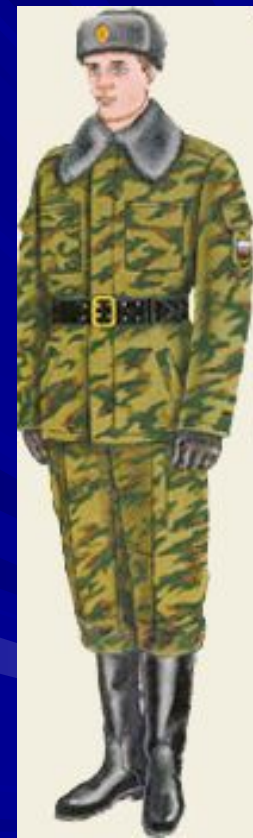
парадная для строя