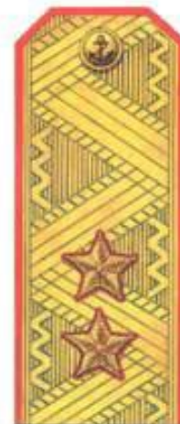
Генерал-лейтенант (парадная форма одежды, береговые войска)