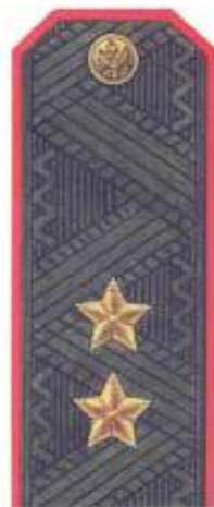
Генерал-лейтенант (повседневная форма одежды)