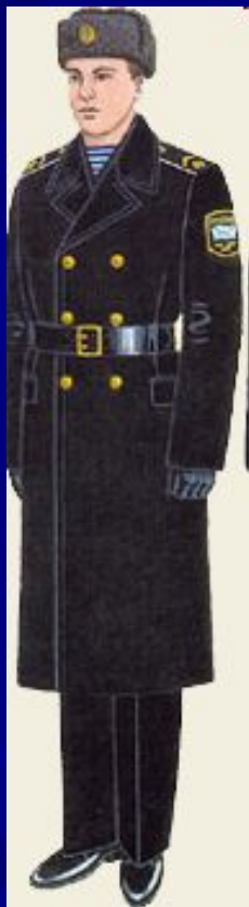
парадная для строя и вне строя