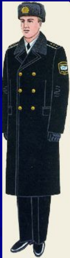
парадная для строя и вне строя