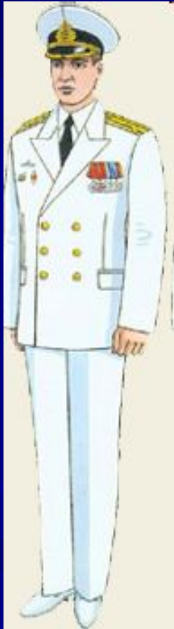
парадная для строя и вне строя