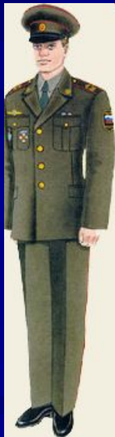
парадная вне строя