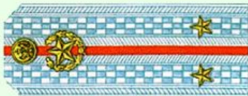
Лейтенант (парадная форма одежды)