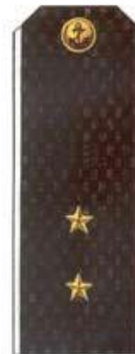
Мичман (повседневная форма одежды, ВМФ)