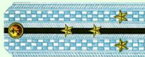
Капитан-лейтенант (парадная форма одежды, ВМФ)