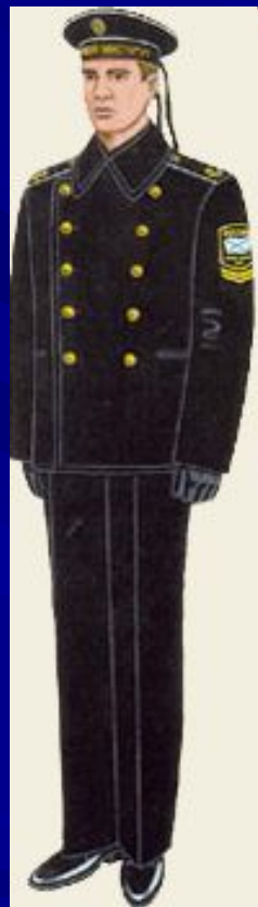
парадная вне строя курсантов