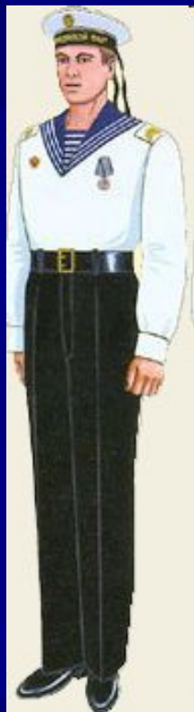
парадная для строя и вне строя