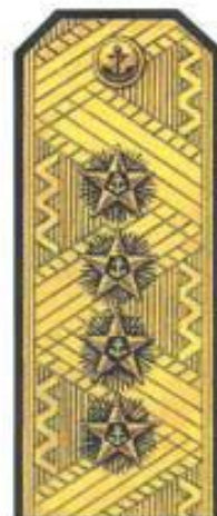
Адмирал флота (парадная форма одежды)