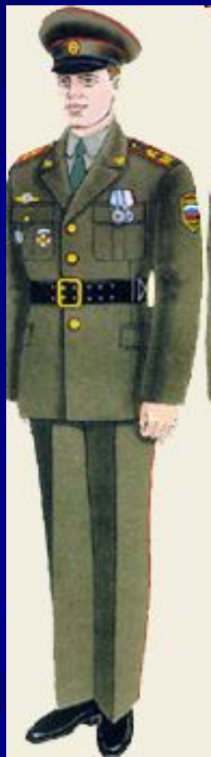
парадная для строя