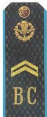
Младший сержант (ВДВ)