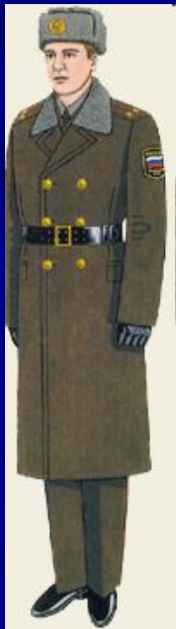
Повседневная для строя