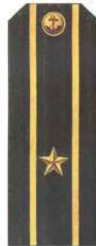
Капитан 3 ранга (повседневная форма одежды)