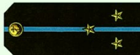
Старший лейтенант (повседневная форма одежды, морская авиация)