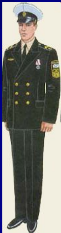
парадная вне строя курсантов