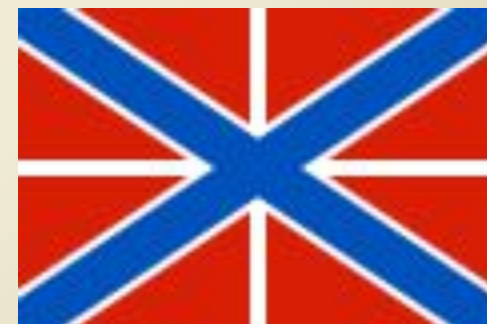
Гюйс кораблей и судов ВМФ Росси