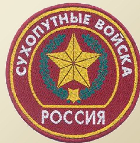
Нарукавный знак Сухопутных войск РФ