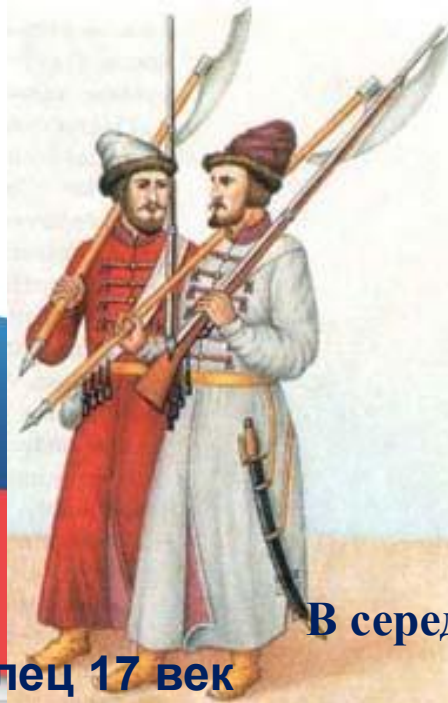
В середине 17 века не один гарнизон не обходился без стрельцов.