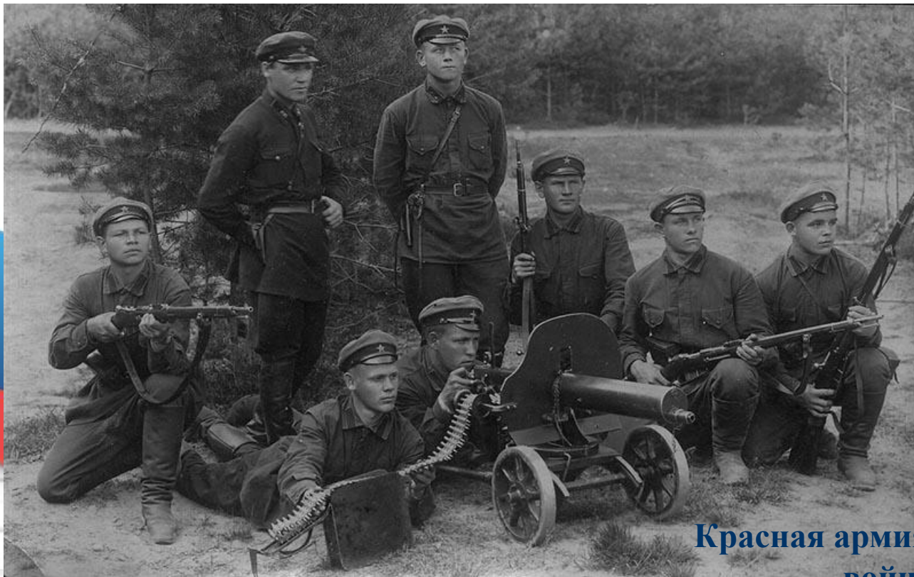
Красная армия на кануне войны

Советское правительство увеличивало численность армии. К началу 1941 года численность вооруженных сил составляла 5,7 миллионов человек . Велось постоянное техническое переоснащение вооруженных сил.