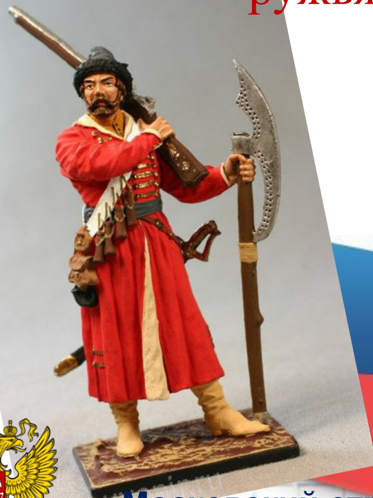
Московский стрелец 17 век

Они были вооружены пищалями (фитильными ружьями) и боевыми топорами.