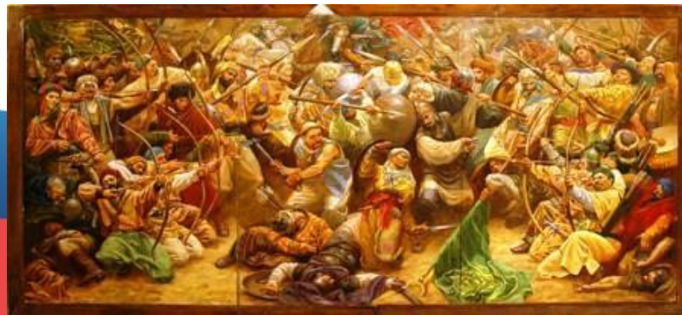
Феодальная война на Руси