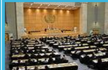
Главный зал ООН в Женеве