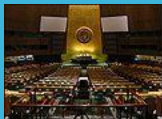
Зал Генеральной Ассамблеи ООН