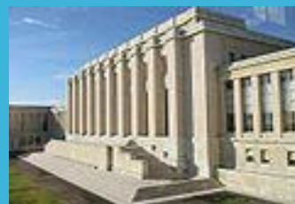
Здание ООН в Женеве