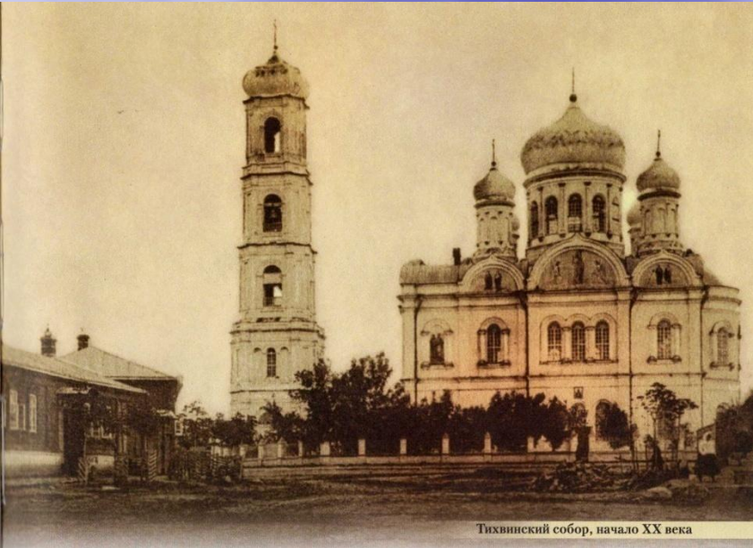
Тихвинский собор, начало XX века

Разрешение на строительство собора данковчане получили от царя в 1860 году. До этого времени на данном месте стояла каменная часовня.