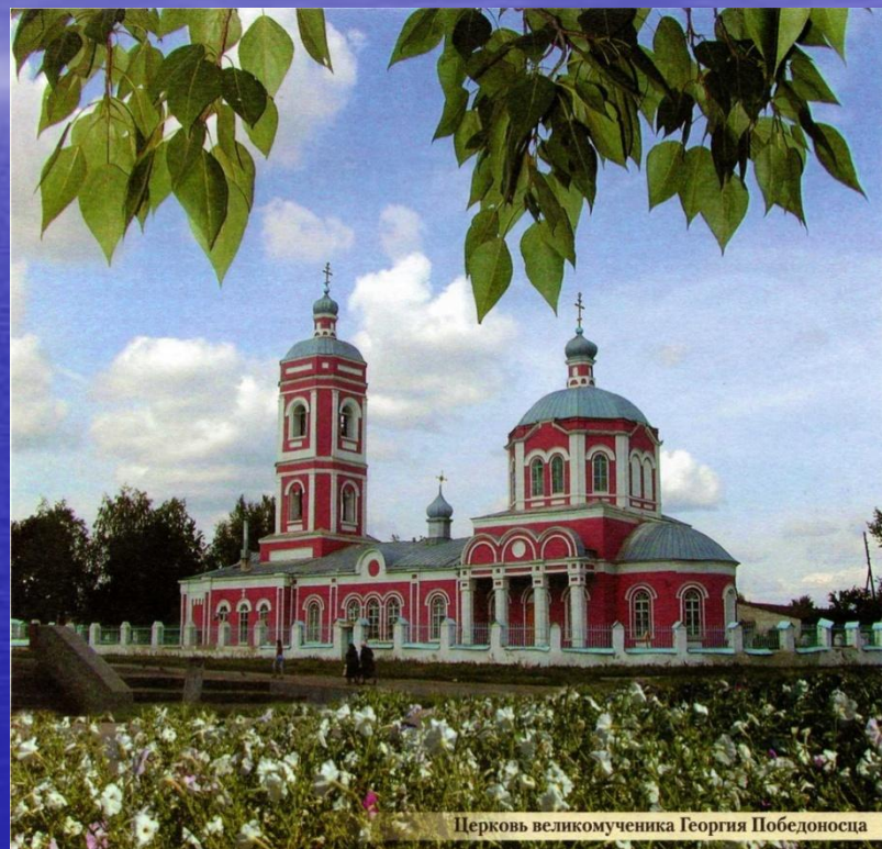
Церковь великомученика Георгия Победоносца

Изначально церковь принадлежала Казачьей слободе. Руководствуясь данными окладных книг, мы можем утверждать, что на этом месте в 1676 году стоял деревянный храм. В 1791 году он сгорел. Спустя девять месяцев прихожане купили новую церковь в Урусове.