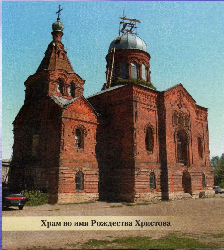
Храм во имя Рождества Христова

В 2005 году возобновились богослужения в еще одном храме, закрытом советской властью в 30-е годы. Вот что повествуют писцовые книги XVIII века о церкви Сторожевской слободы Данкова: «В Данкове же на посаде, на берегу реки Вязовенки, слобода сторожевых казаков, а в ней церковь во имя Рождества Христова, да придел Николы Чудотворца, древяна клецки с папертью...»