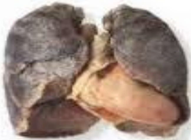
Курить - это круто!