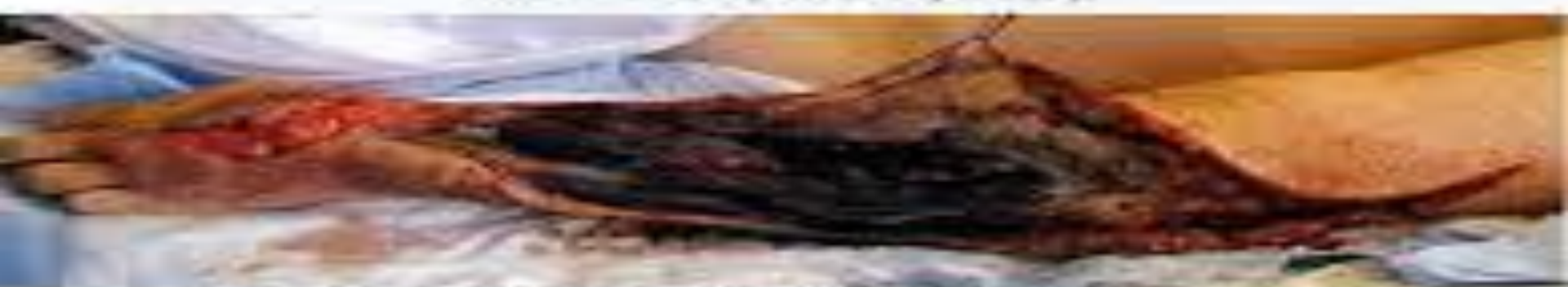
Рис. 4. Тот же больной вид с другой стороны. В дельтовидной мышце видна контура ампутированного