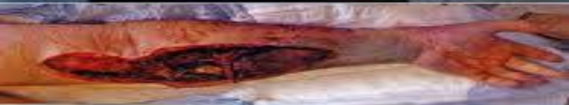
Рис. 3. Газовая контура левой верхней конечности после введения "Коккаина" в кубитальную ямку.