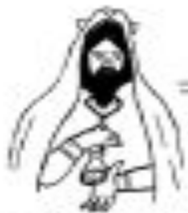
Hermetic Order: The sacred knowledge passed down "by secret agreement"