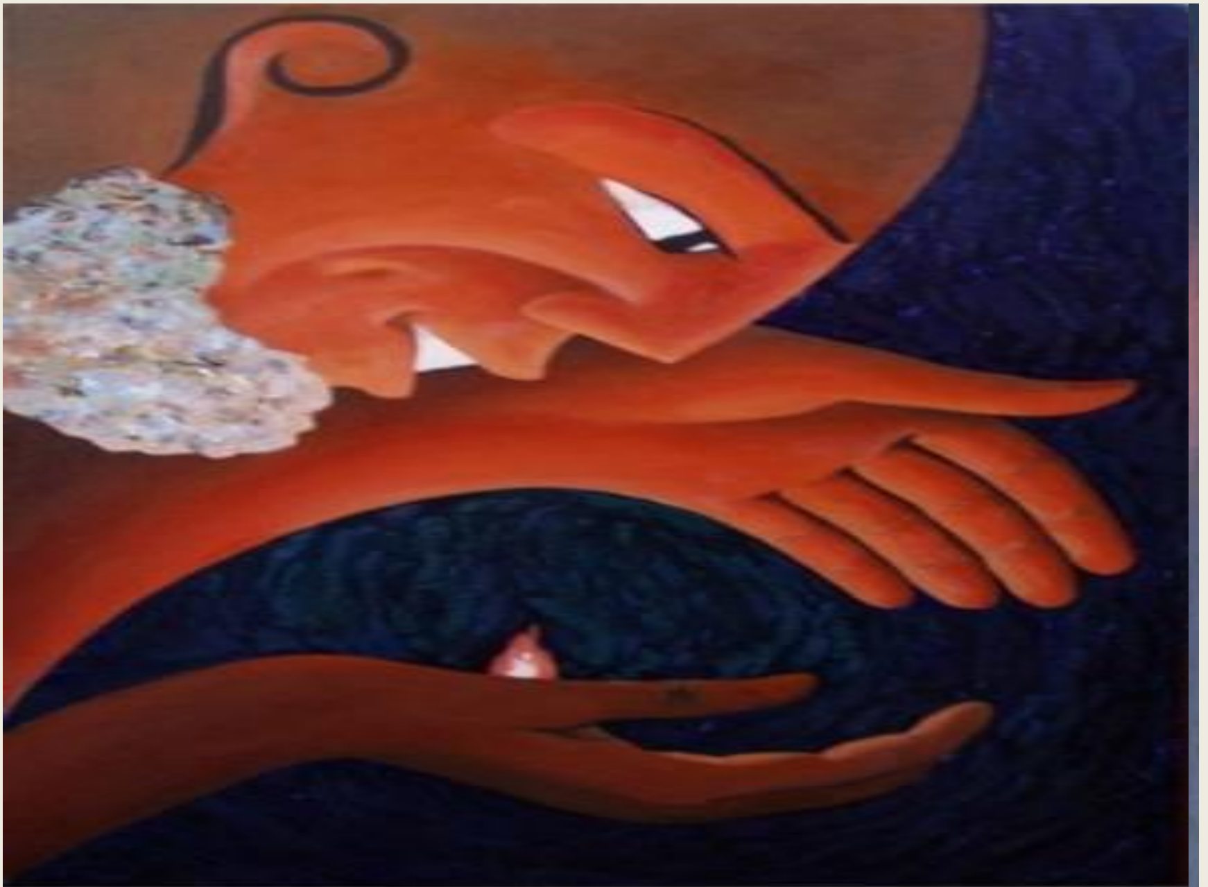
А. Кофанов "Прометей"