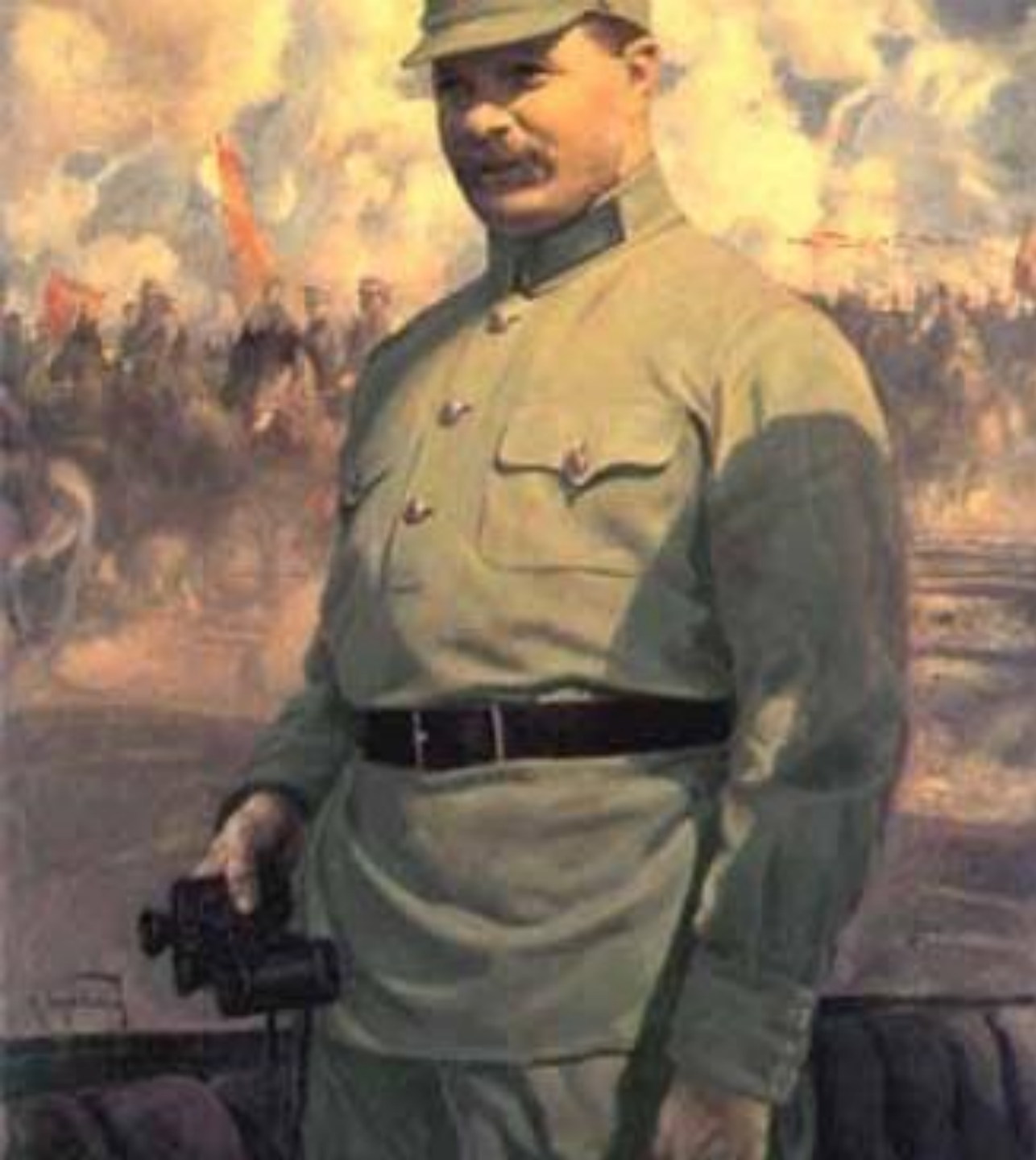
М.В. Фрунзе на маневрах. 1929