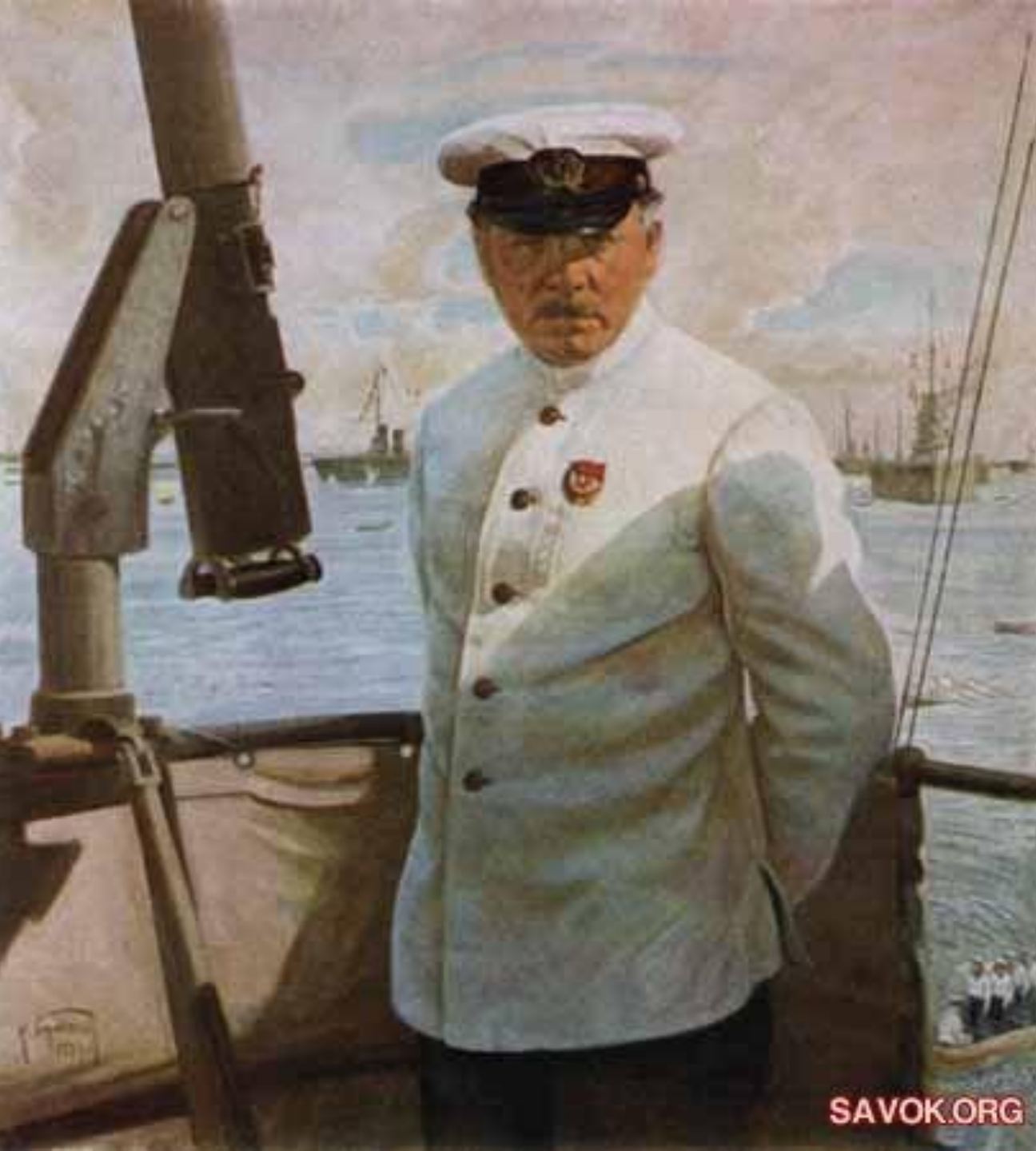
К.Е. Ворошилов на линкоре 1929