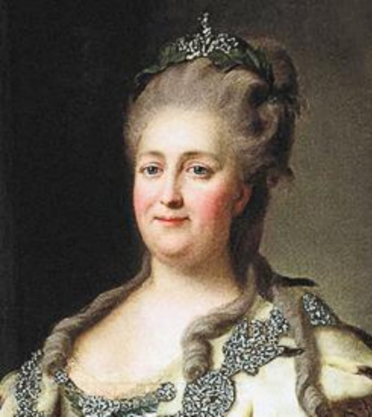
Императрица Екатерина Великая