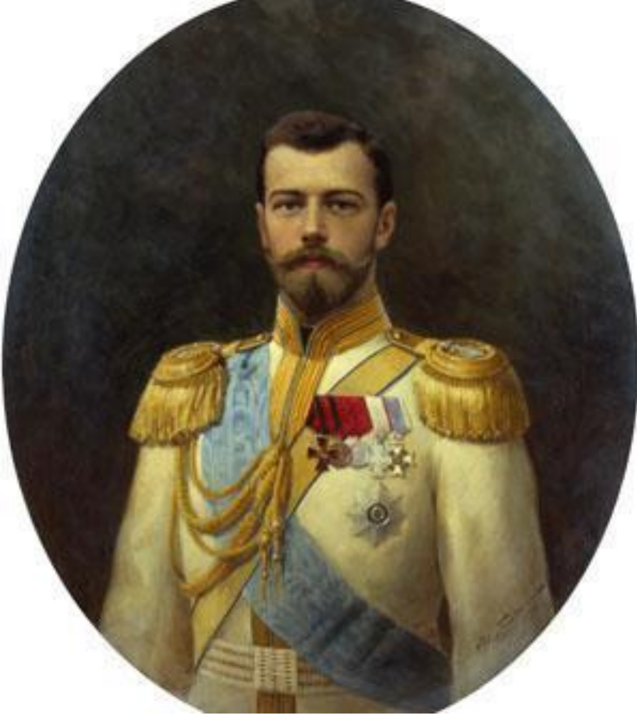
Император Николай Второй.