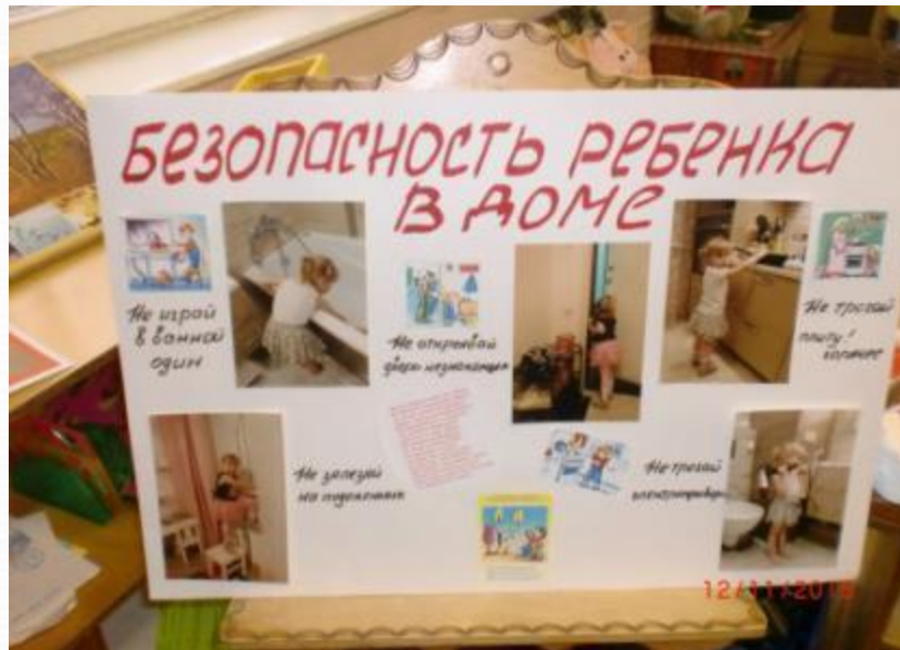
Проект семьи Дородновой Вероники