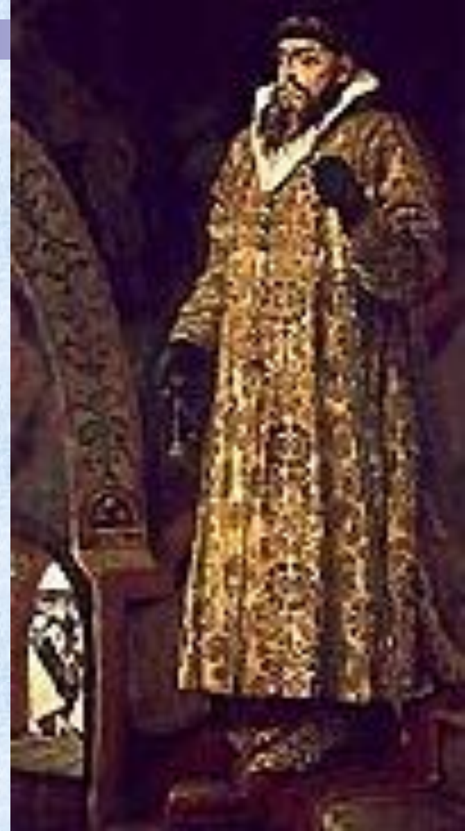
Иоанн Васильевич Грозный

по ведению домашнего хозяйства, воспитанию детей, исполнению в семье определенных правил поведения.