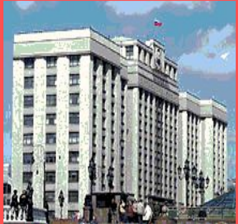
Москва. Здание Государственной думы Российской Федерации