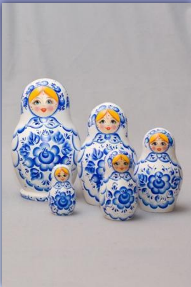
В стиле росписи «Гжель»