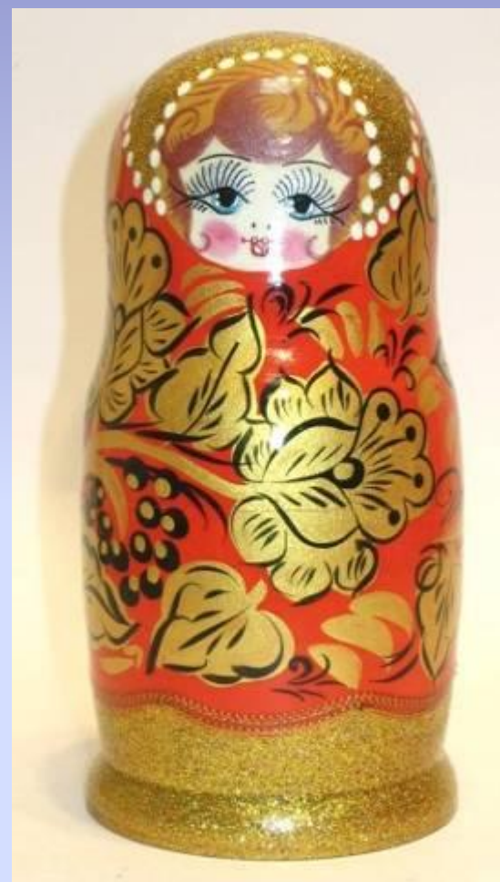
В стиле росписи «Хохлома»