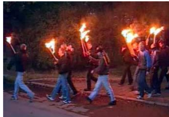
Скинхеды. Факельное шествие в Петербурге.