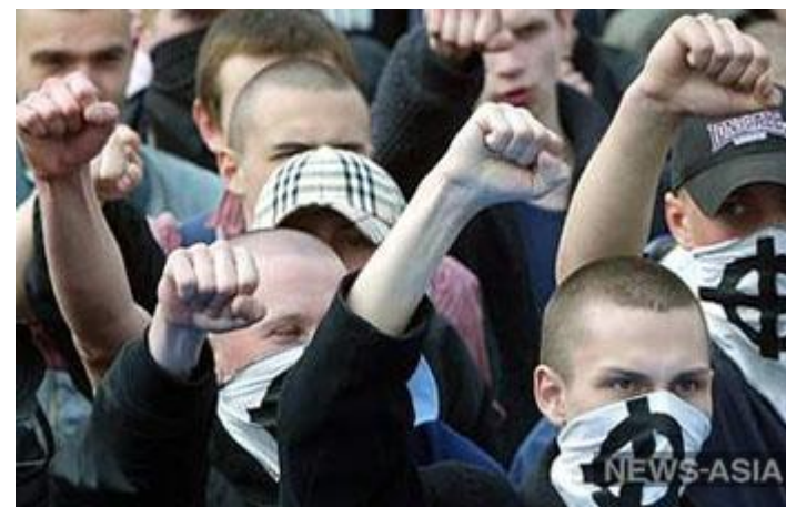
В Костроме скинхеды напали на неформалов