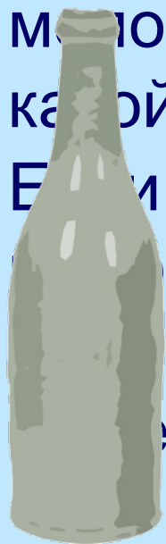
БУТЫЛКА МИНЕРАЛЬНАЯ ВОДА

Если стакан поставить между посудой с чаем и молоком, то по соседству с молоком будет квас, а чай будет точно в середине. Как вы думаете, как разделить посуду так, чтобы точно было известно, что находится в каждой из них?