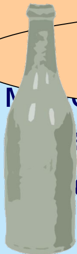
БУТЫЛКА МИНЕРАЛЬНАЯ ВОДА

СЮДА СТАКАН ПОСТАВИТЬ НЕЛЬЗЯ, ЗДЕСЬ ОН БУДЕТ СТОЯТЬ В СЕРЕДИНЕ СТОИТ СТАКАН. ЗНАЧИТ, В НЕМ – КОФЕ!