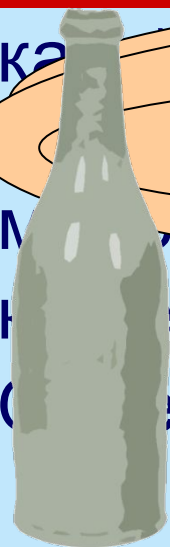
БУТЫЛКА МИНЕРАЛЬНАЯ ВОДА

ЧЕТЫРЕ НАПИТКА ПО СВОЕОБРАЗИЮ МОЖЕТ БЫТЬ, МОЛОКО ЗДЕСЬ?