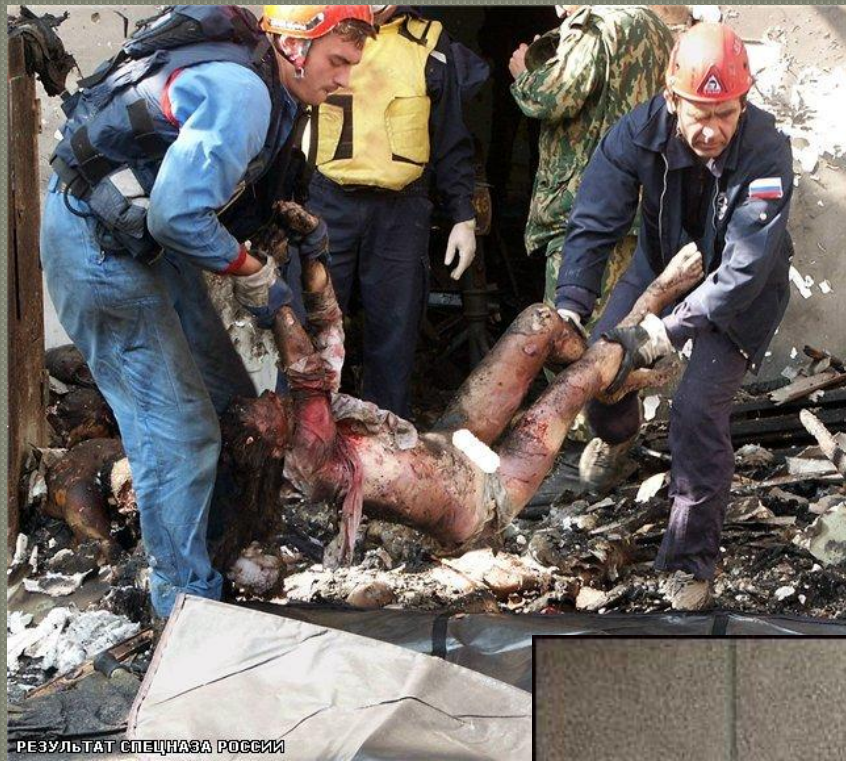
РЕЗУЛЬТАТ СПЕЦНАЗА РОССИИ