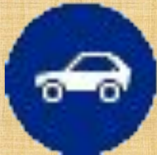
Движение легковых автомобилей