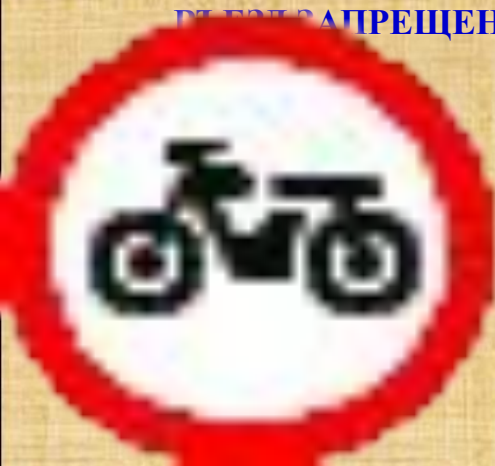
Движение мотоциклов запрещено