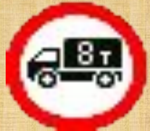
Движение грузовых автомобилей