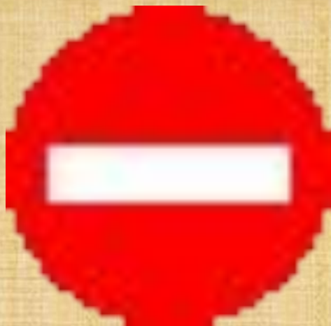
ВЕСЬ ТРАНСПОРТ ЗАПРЕЩЕН