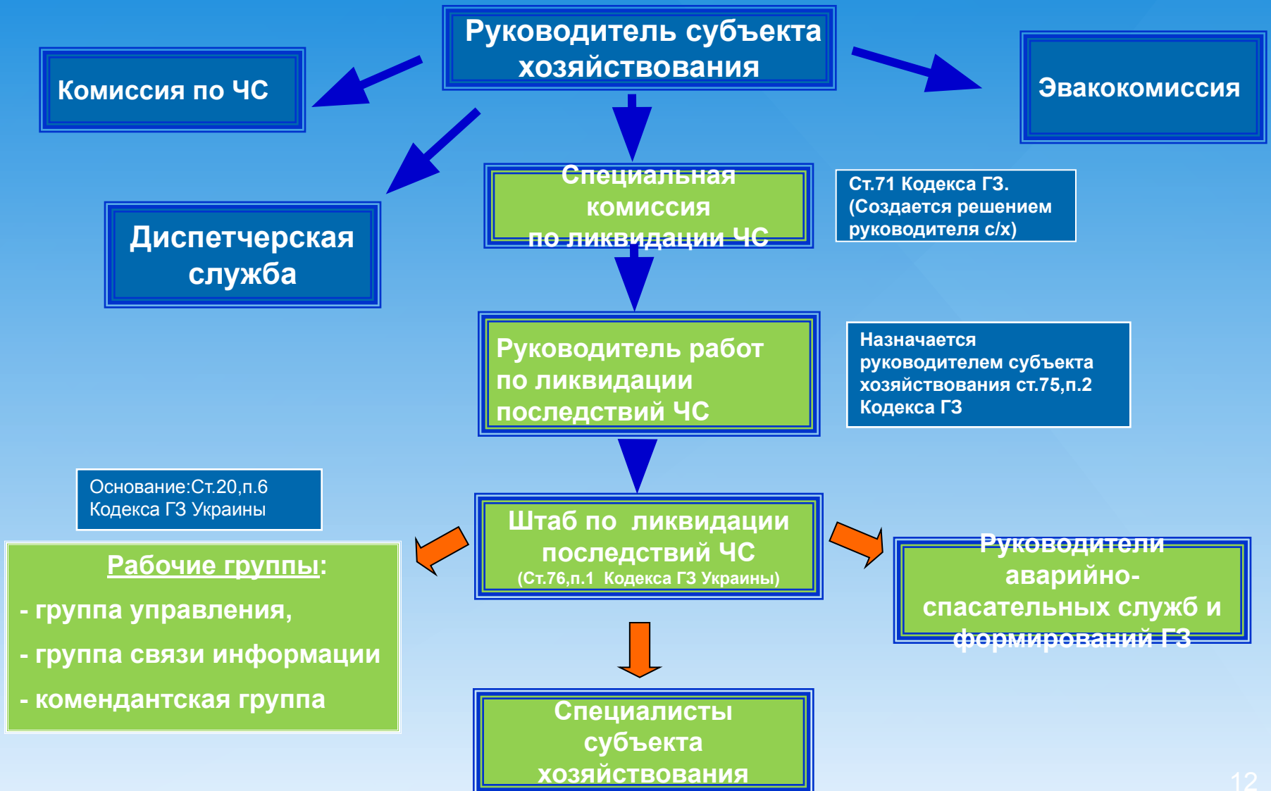
Схема органов управления субъекта хозяйствования в режиме чрезвычайной ситуации