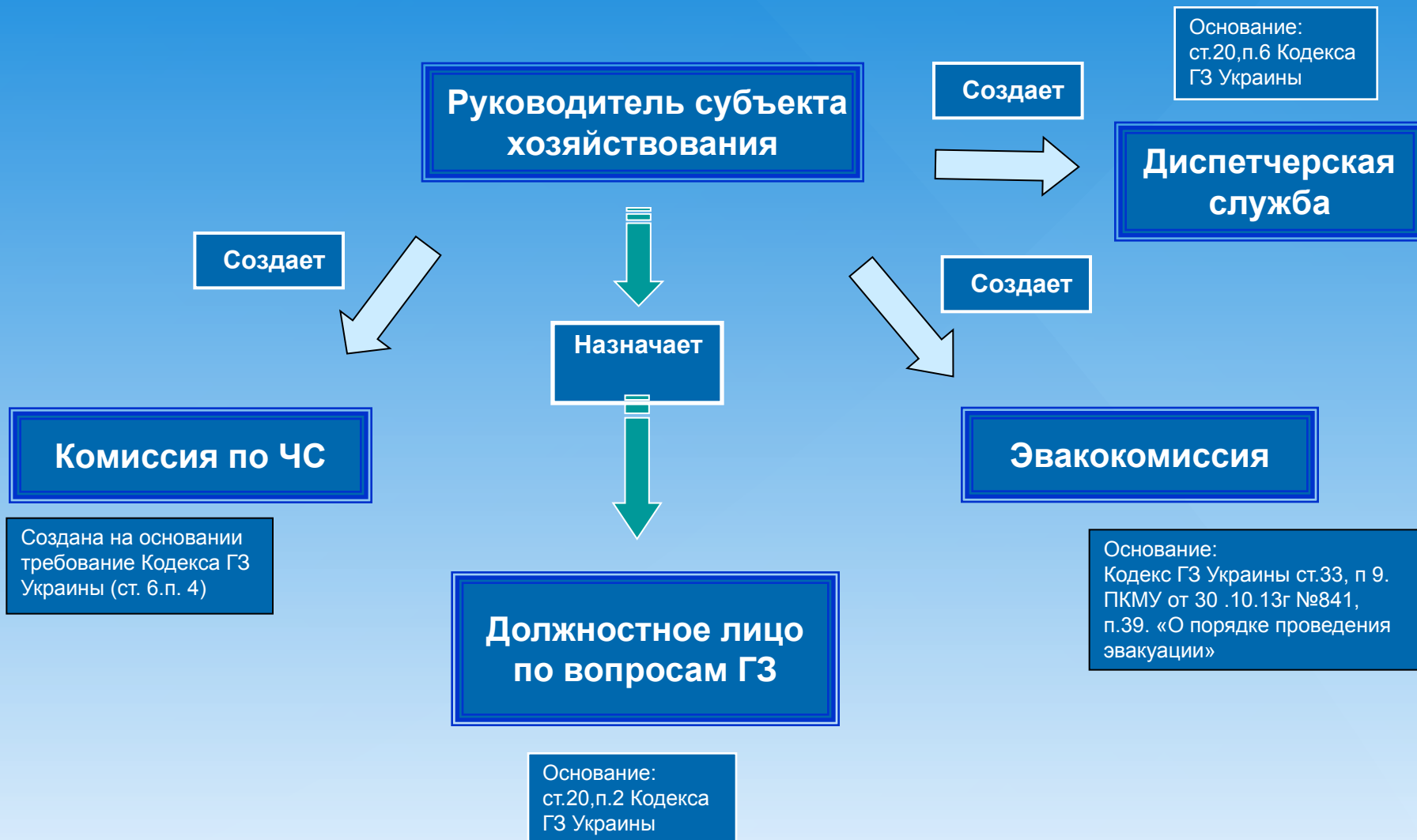
Схема органов управления субъекта хозяйствования в режимах повседневной деятельности и повышенной готовности