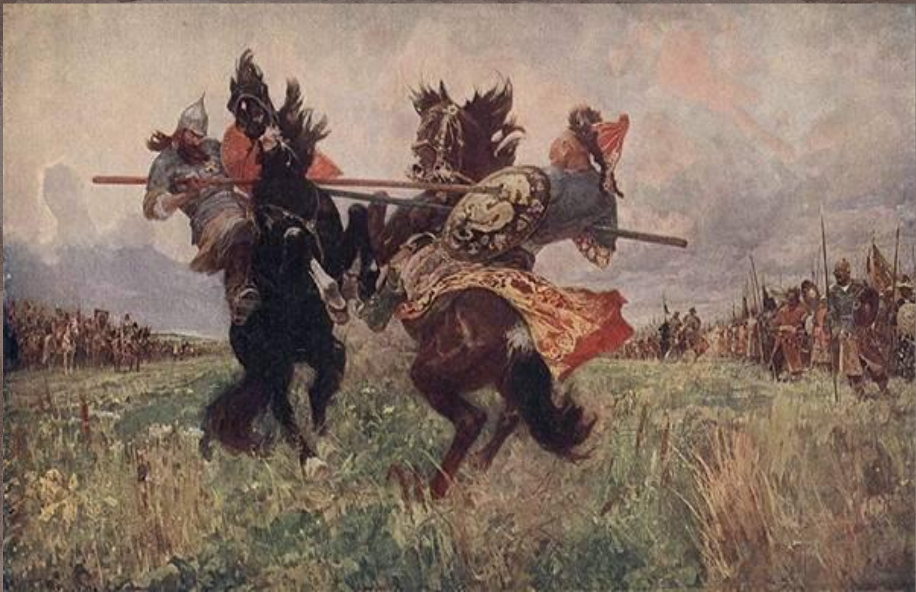
М.И. Авилов. "Бой Пересвета с Челубеем", 1943.