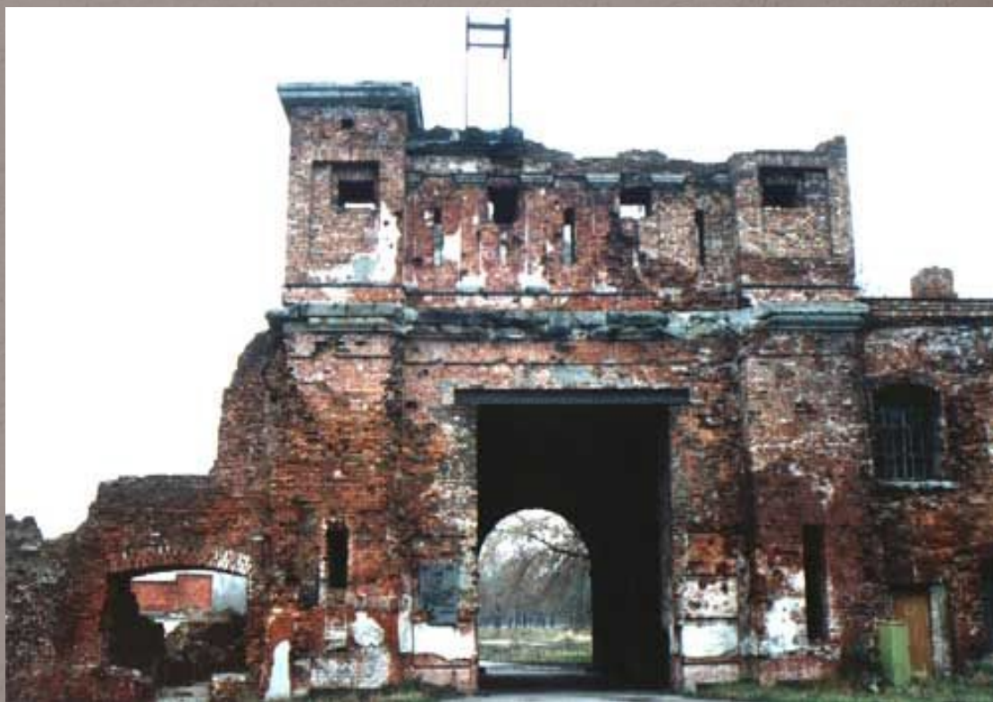
Руины Тереспольских ворот