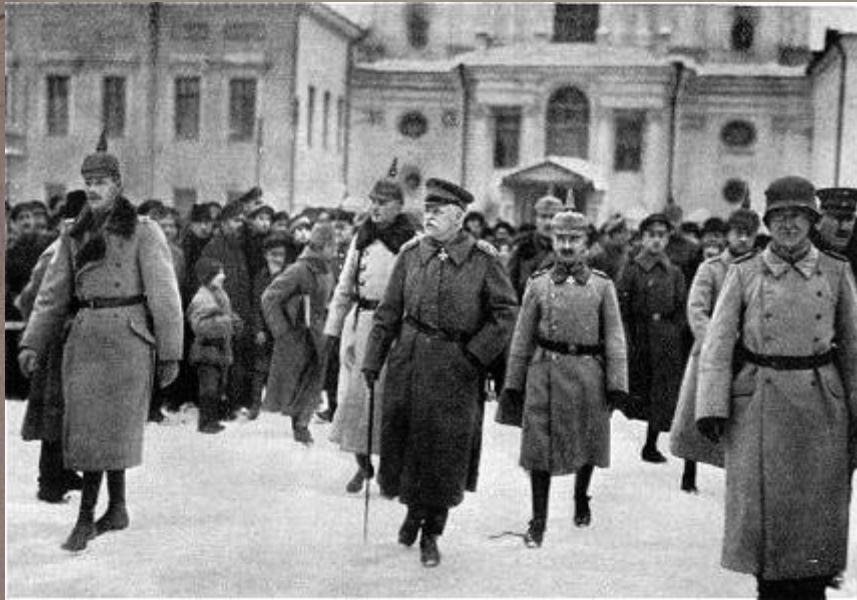
Генерал Эйхгорн в оккупированном Минске, февраль 1918

В 1914 году началась первая мировая война. После установления в нашей стране Советской власти началась иностранная интервенция.