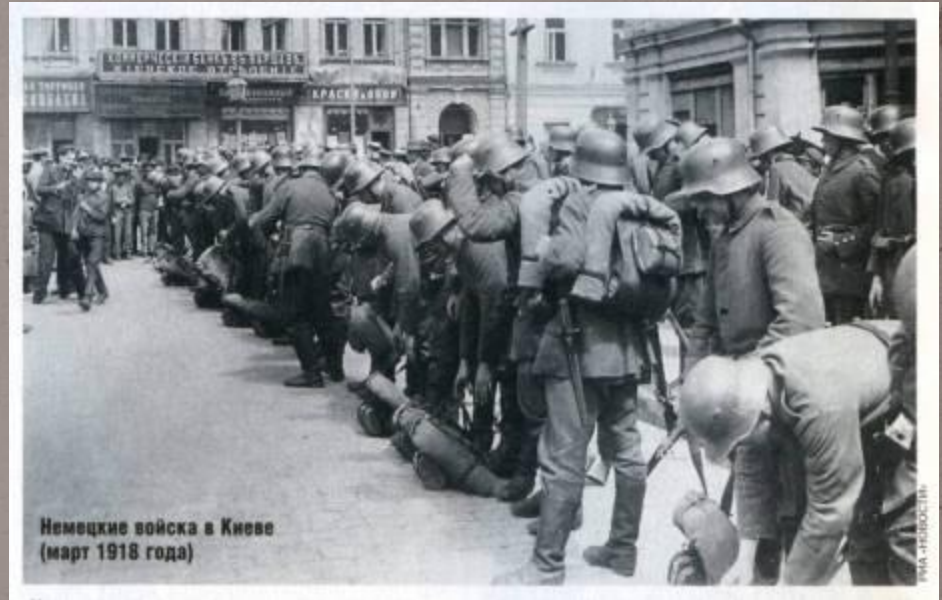
Немецкие войска в Киеве, март 1918 г.