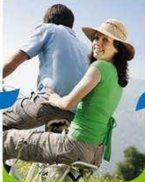
Активный образ жизни