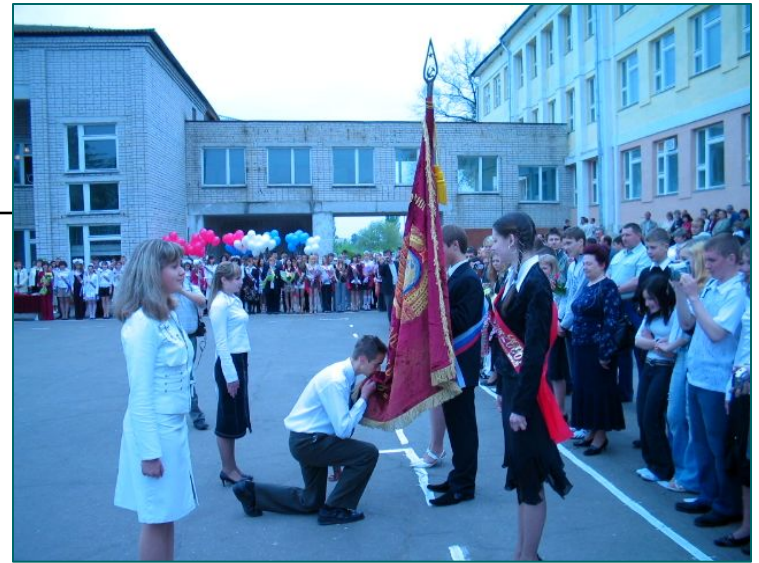
Прощание со Знаменем лица