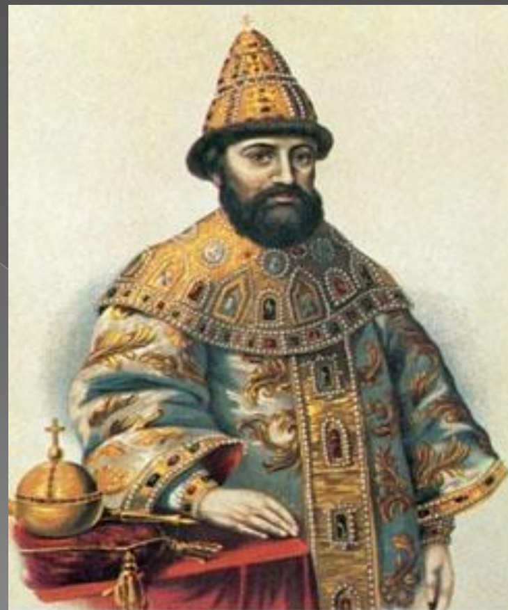
Михаил Федорович (1596-1645)