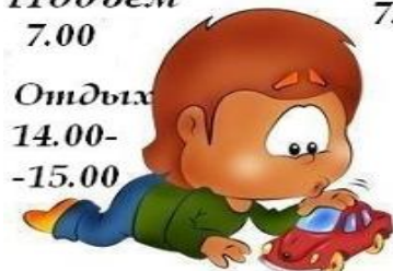
Отдых 14.00- -15.00