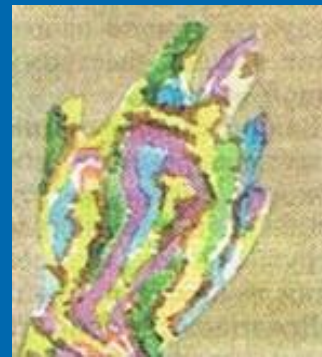
через 17,5 мин