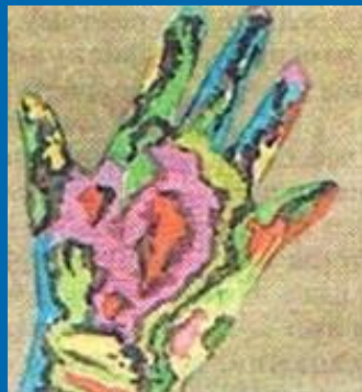
После выкуривания одной сигареты через 7,5 мин