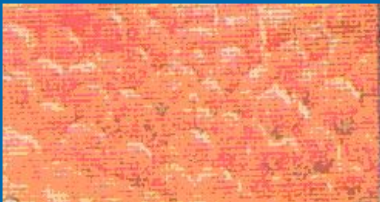
Легочная ткань курящего человека