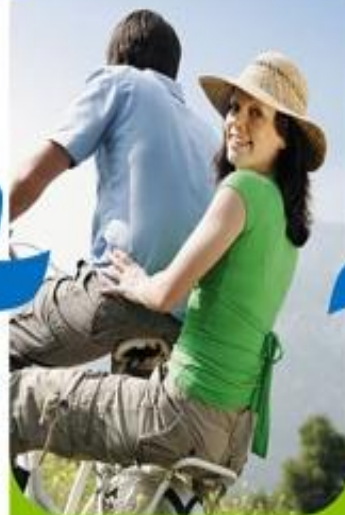
Активный образ жизни