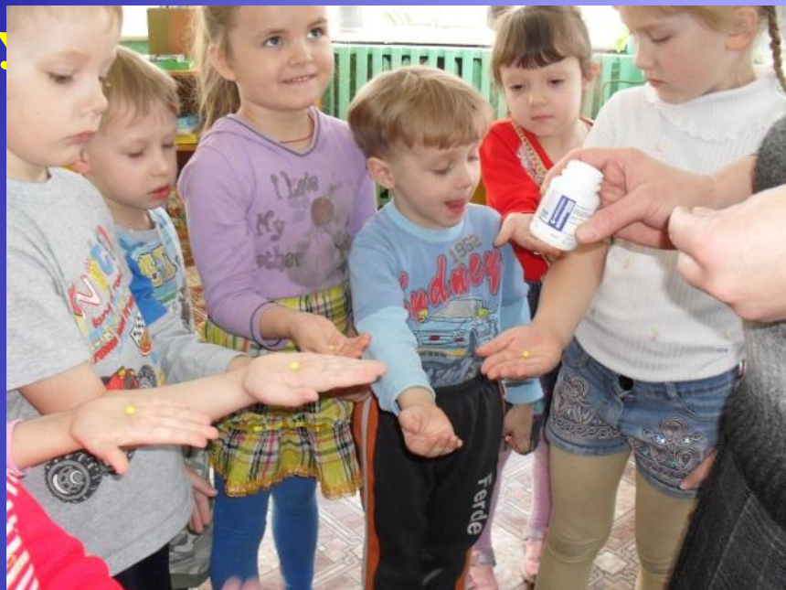
Витамины А, В, С.