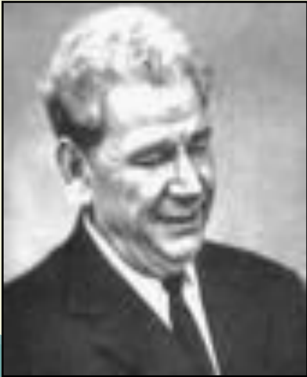
П. К. Анохин

Всю деятельность системы и ее всевозможные изменения можно представить целиком в терминах результата :