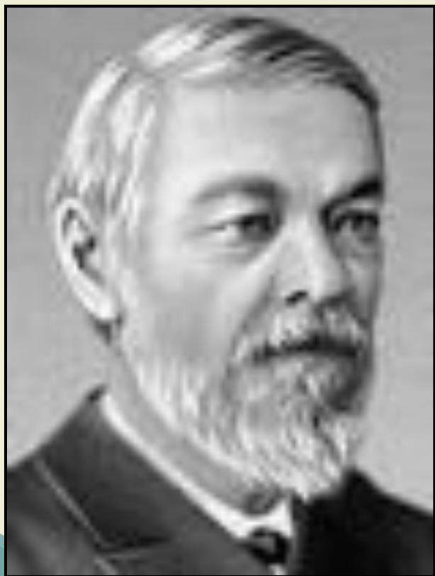
И. М. Сеченов

«Жизненные потребности рождают хотения, и уже эти ведут за собой действия : хотение будет мотивом или целью, а движение – действием или средством достижения цели. Без хотения как мотива или импульса движение было бы вообще бессмысленно...»