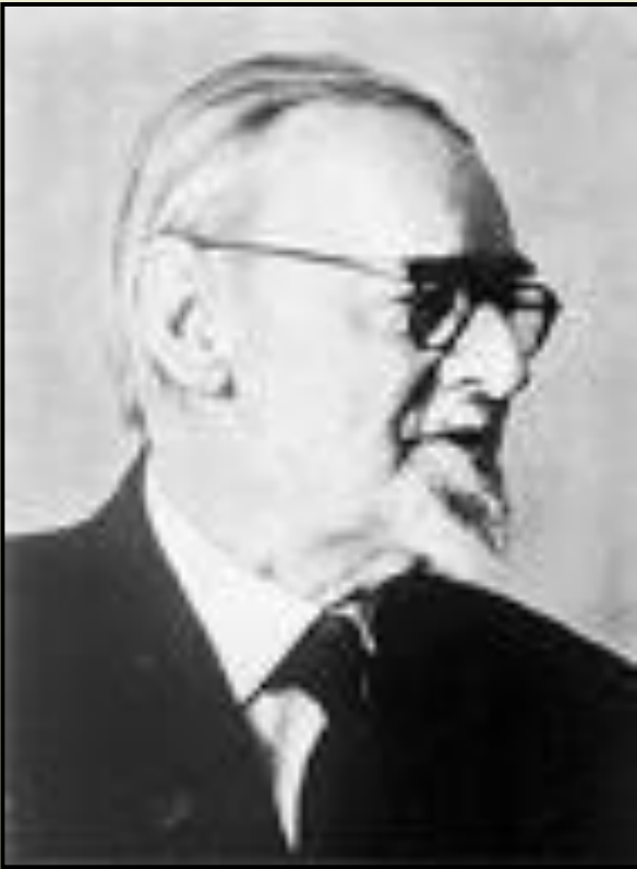
Н. А. Бернштейн