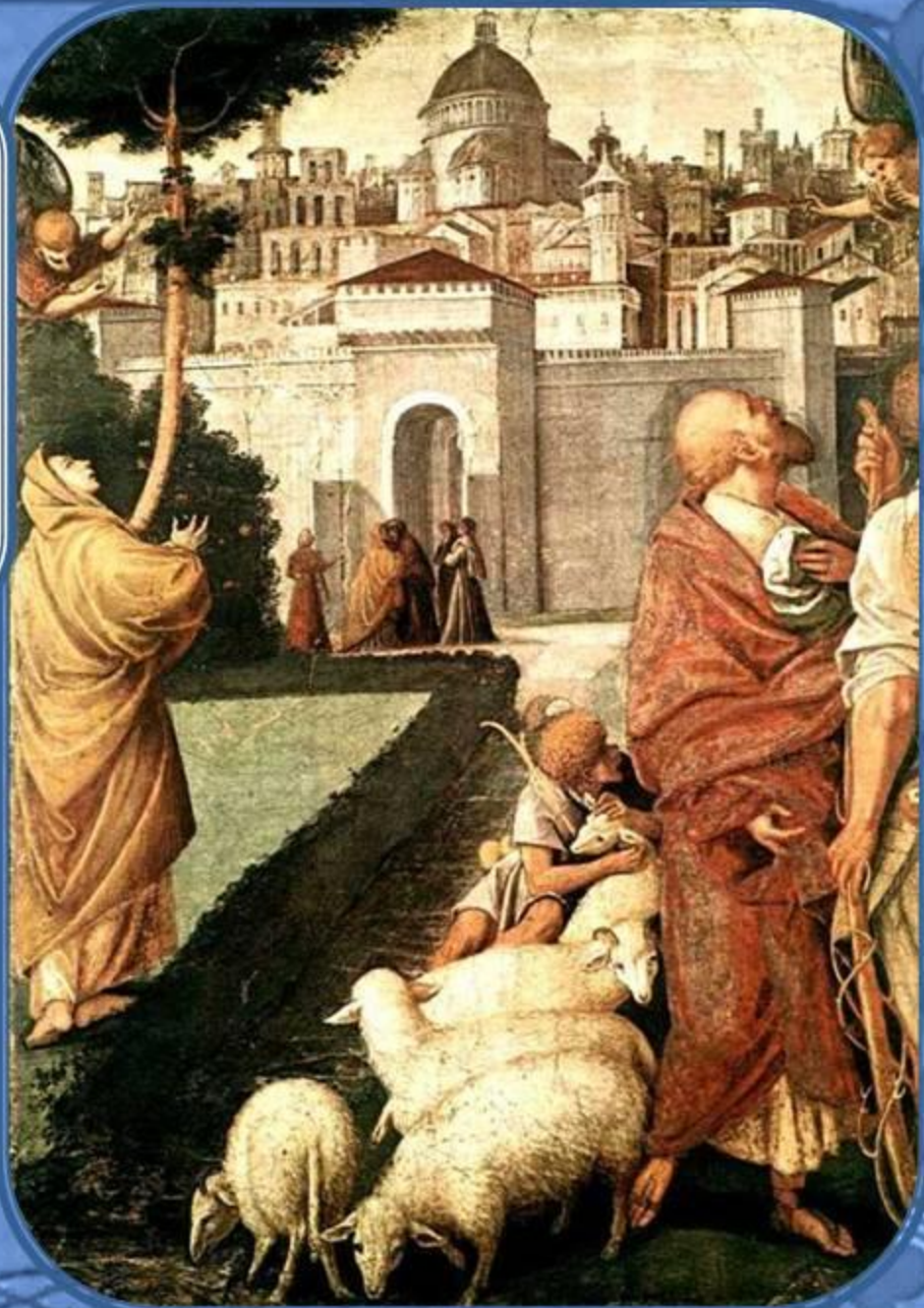
Гауденцио Феррари. Благовещение Иоакиму и Анне

Поэтому, несмотря на свою старость, Иоаким и Анна не переставали просить у Бога, чтобы Он даровал им дитя.