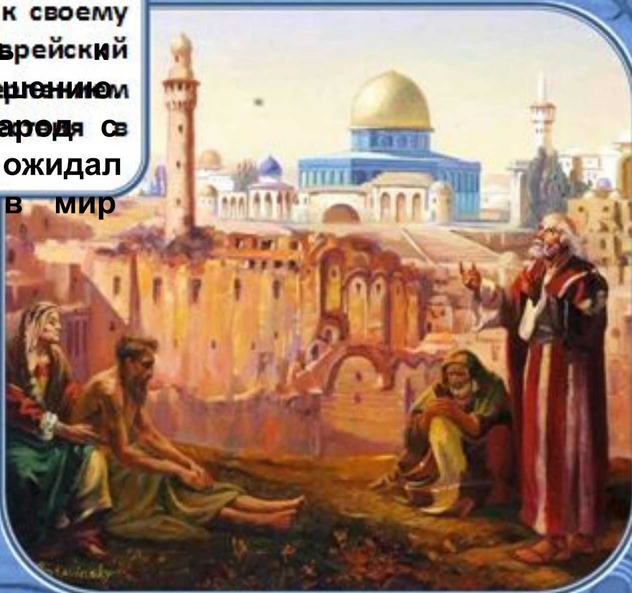
Иерусалим. О. Стаунский Ставинский

Ветхозаветные времена время приближали своему завершению Еврейский народ с нетерпением ожидал пришествия в мир Мессии.