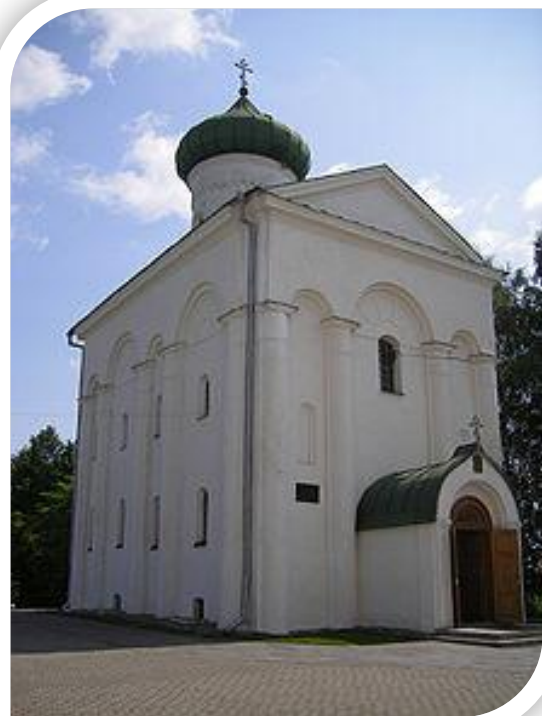
Спаса-Праабражэнская царква (Спасаўскі сабор)

«Жыццё» апавядае, што аднойчы ангел у сне ўзяў Ефрасінню і прывёў у Сяльцо, за две вярсты ад Полацка на беразе Палаты, і сказаў: «Тут належыць табе быць!» Сон паўтарыўся тройчы. Пасля гэтага полацкі епіскап Ілля, паклікаўшы полацкага князя Барыса, бацьку Святаслава і іншых знатных палачан, абвясціў, што аддае чарніцы Сяльцо.