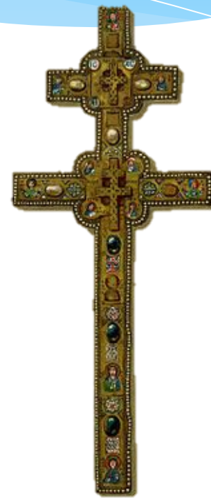
Крыж Ефрасінні Полацкай. Выява 1889 года

Крыж захоўваўся ў царкве Святога Спаса да пачатку XIII ст., пасля спярша быў перавезены ў Смаленск, адтуль у 1514 годзе Іванам III у Маскву, аднак быў вернуты на радзіму Іванам Грозным. Падчас вайны 1812 года крыж быў схаваны ў сцяне Сафійскага сабора ў замураванай нішы, а ў 1841 годзе вернуты ў храм Спаса.