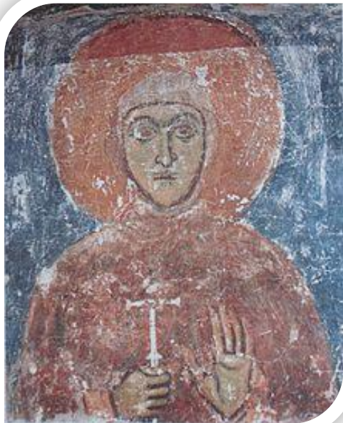
Роспіс сцен Спаса- Ефрасінняўскай царквы. Выява святой пакутніцы

Будаваў царкву Святога Спаса вядомы дойдзі Іаан. Царква ў Сяльцы ўяўляе сабой трохнефны шасцістаўповы крыжова-купальны храм памерам 8x12 метраў. Пабудаваны на берэзе Палаты храм стаяў на месцы старой рэзідэнцыі полацкіх епіскапаў а Ефрасіння тады ж была ўзведзена ў сан ігуменні гэтага манастыра. Спасаўскі сабор два з паловай стагоддзі належаў ордэну езуітаў і быў касцёлам. На сёння — гэта адзіны ў Беларусі храм, дзе захаваліся роспісы XII стагоддзя.