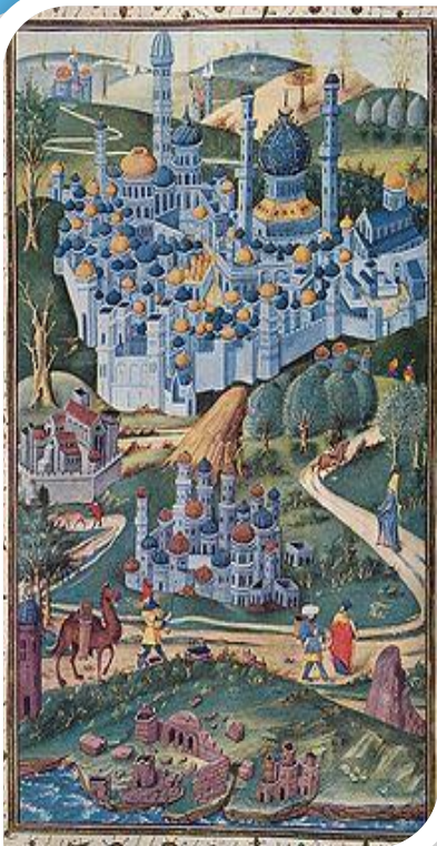
Выява гарадоў Святой зямлі (на дальнем баку бачны Іерусалім), 13 ст.

У канцы жыцця Ефрасіння намерылася выехаць у доўгае падарожжа ў Іерусалім, што было з трывогай успрыята палачанамі. На развітанне з Ефрасінняй прыбываюць у Полацкі манастыр яе браты Васілька, Вячаслаў і Давід. Любімы брат Вячаслаў прыязджае з дзвюма дочкамі — Кірыніяй і Вольгай, якіх прадстаўляе сястры і просіць аб блаславенні, што сведчыць аб вялікай пашане, якой пры жыцці была ўганаравана Еўфрасіння, а пасля спаўняе волю Еўфрасінні, каб дзве яго дачкі засталіся на паслушанні ў манастыры. Ігуменства над манастырамі Еўфрасіння перадае сваёй сястры Еўдакіі.