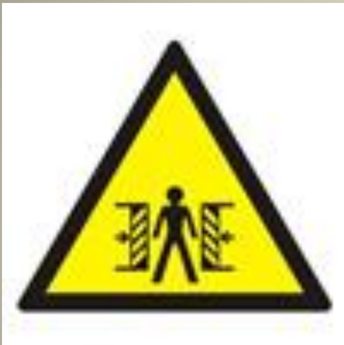
Внимание. Опасность зажима