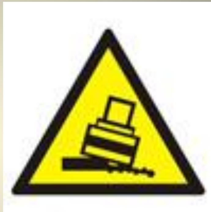
Осторожно. Возможно опрокидывание