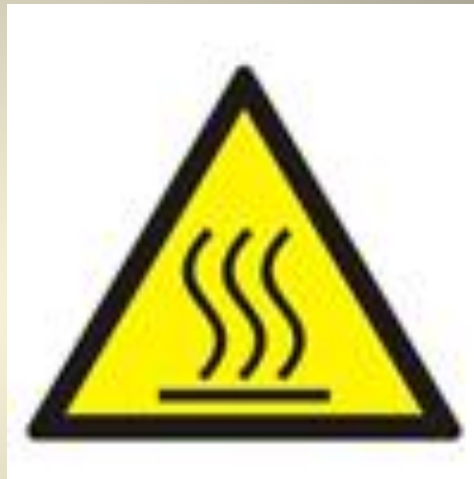
Осторожно. Горячая поверхность