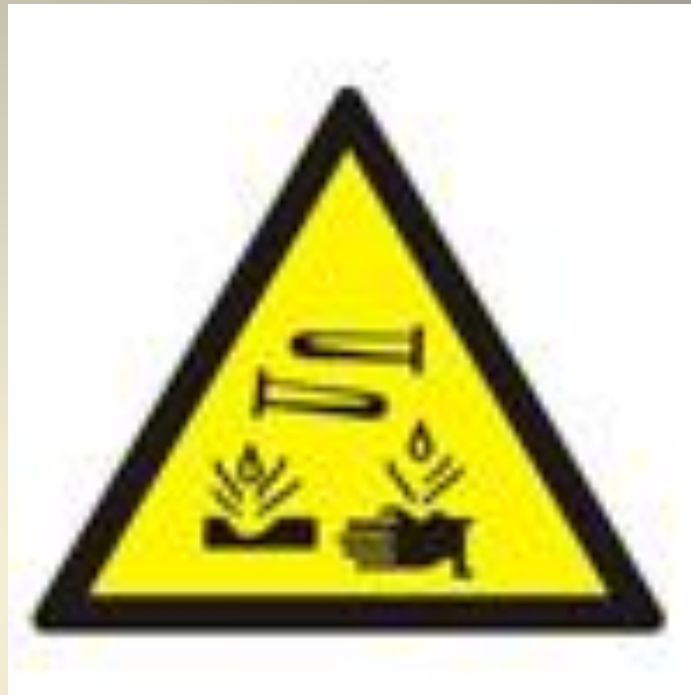
Опасно. Едкие и коррозионные вещества