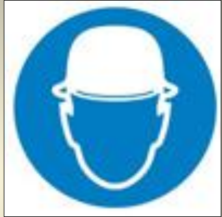
Работать в защитной каске (шлеме)