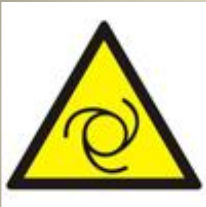
Внимание. Автоматическое оключение (запуск) оборудования