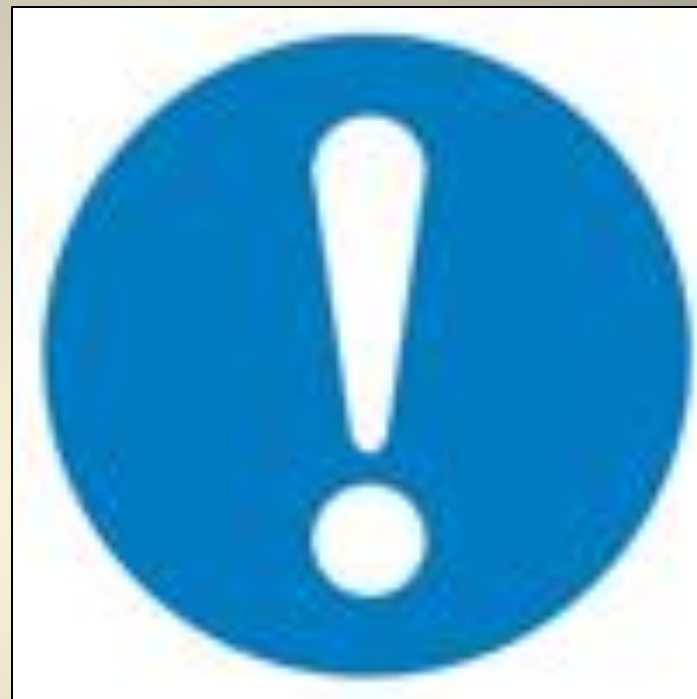
Общий предписывающий знак (прочие предписания)