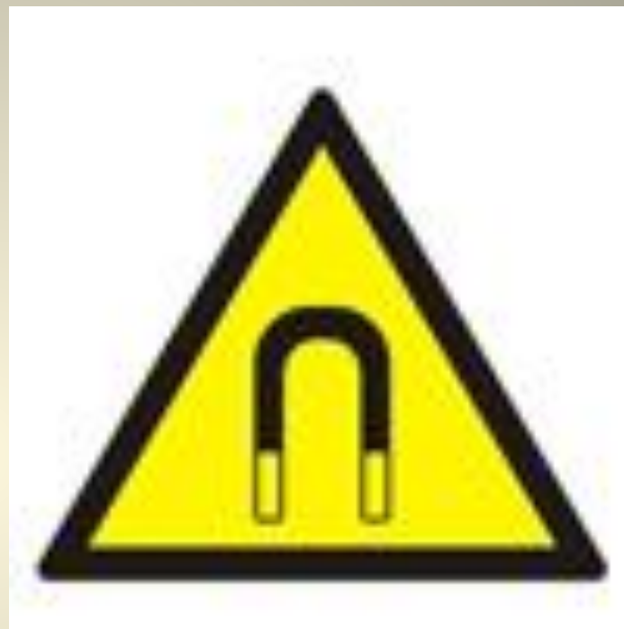
Внимание. Магнитное поле