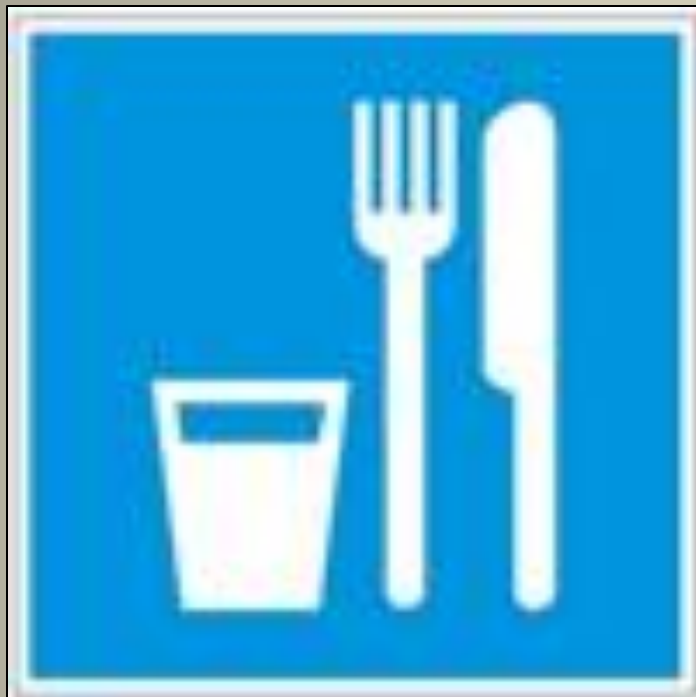
Пункт (место) приёма пищи