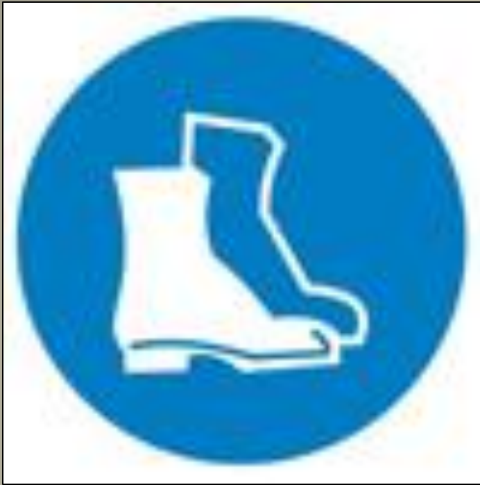
Работать в защитной обуви