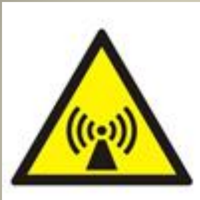
Внимание. Электромагнитное поле