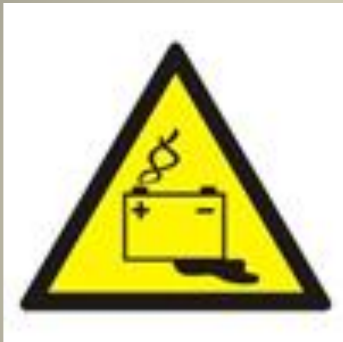
Осторожно. Аккумуляторные батареи