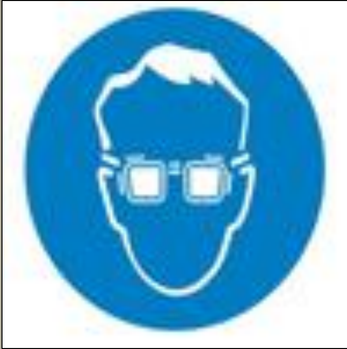
Работать в защитных очках