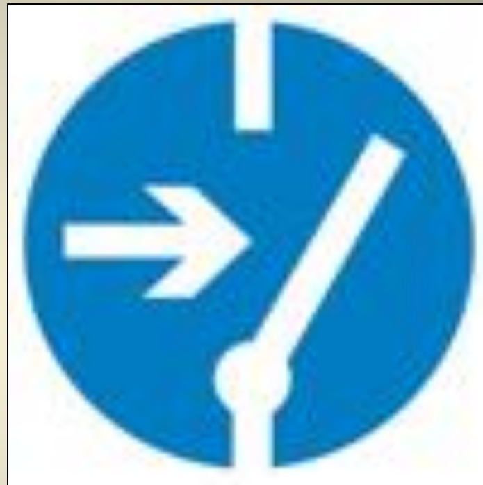
Отключить перед работой