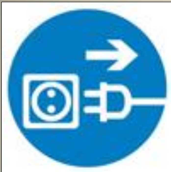
Отключить штепсельную вилку