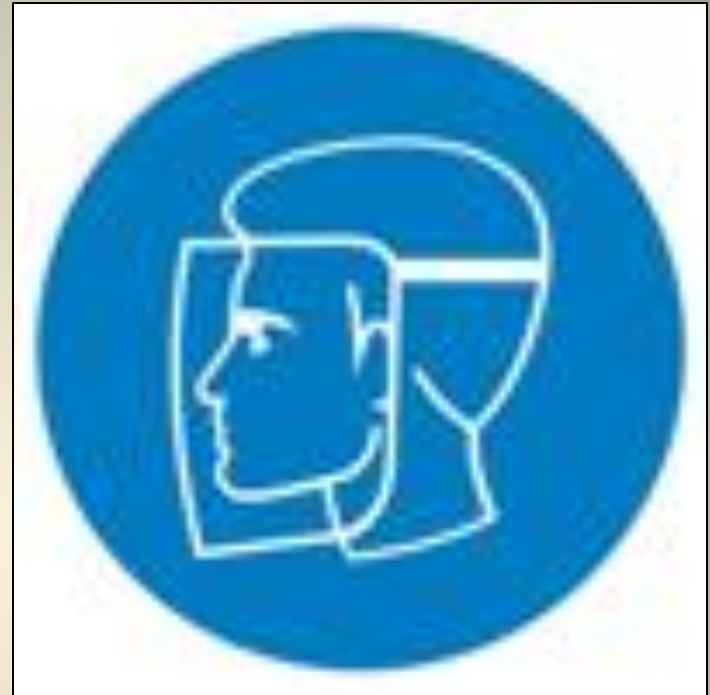
Работать в защитном щитке