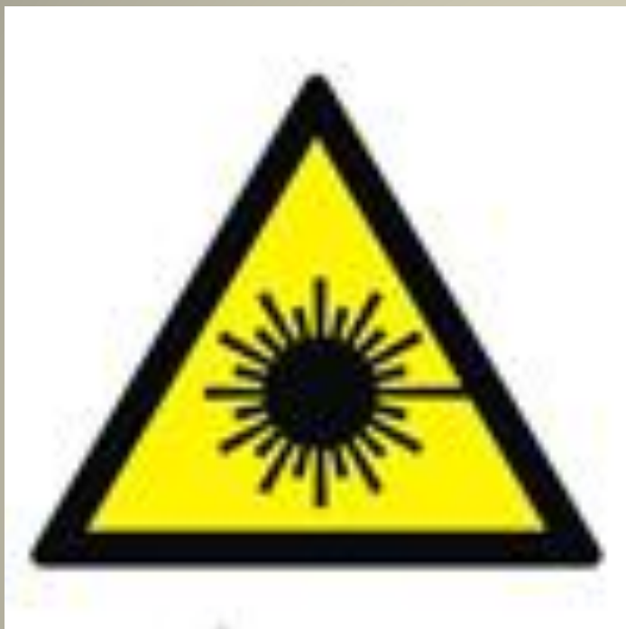
Опасно. Лазерное излучение