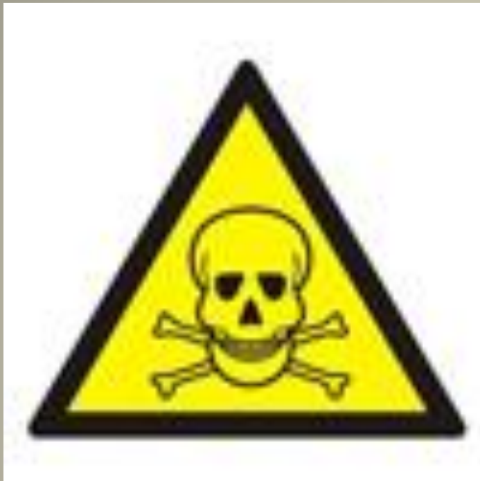
Опасно. Ядовитые вещества