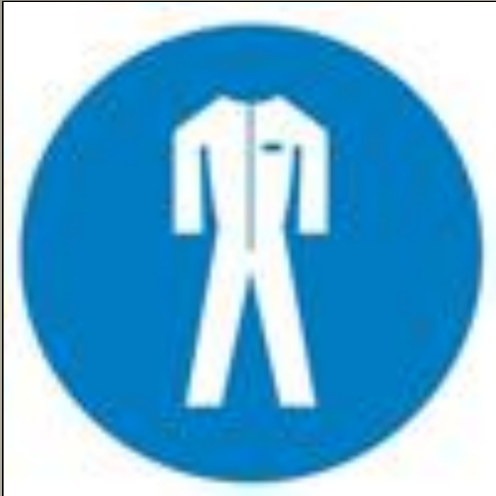
Работать в защитной одежде