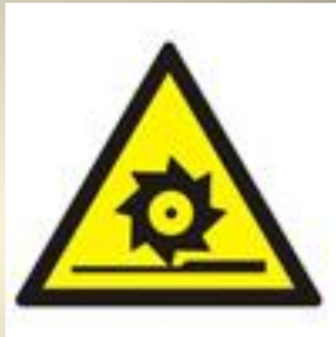
Осторожно. Режущие валы