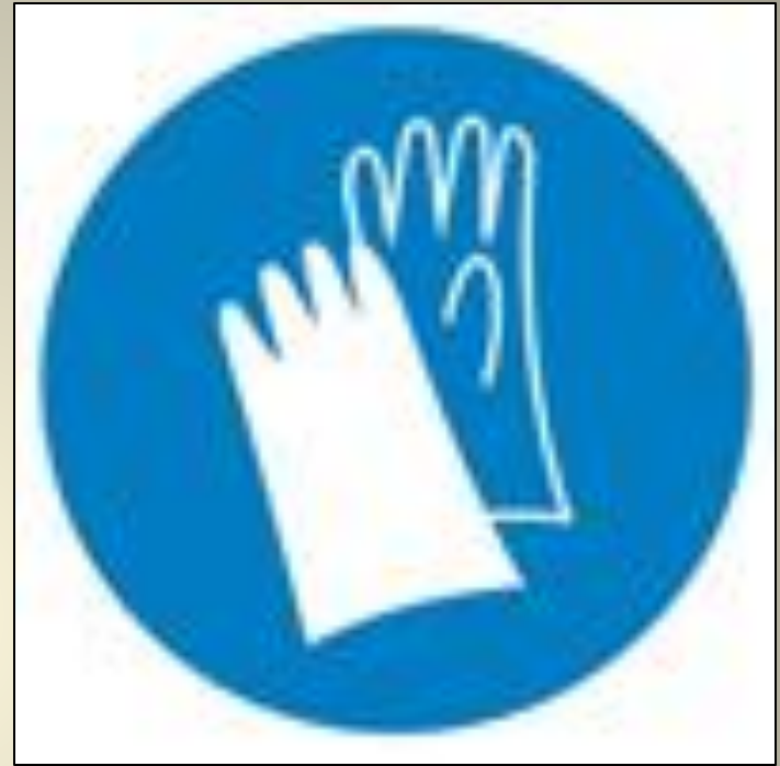
Работать в защитных перчатках