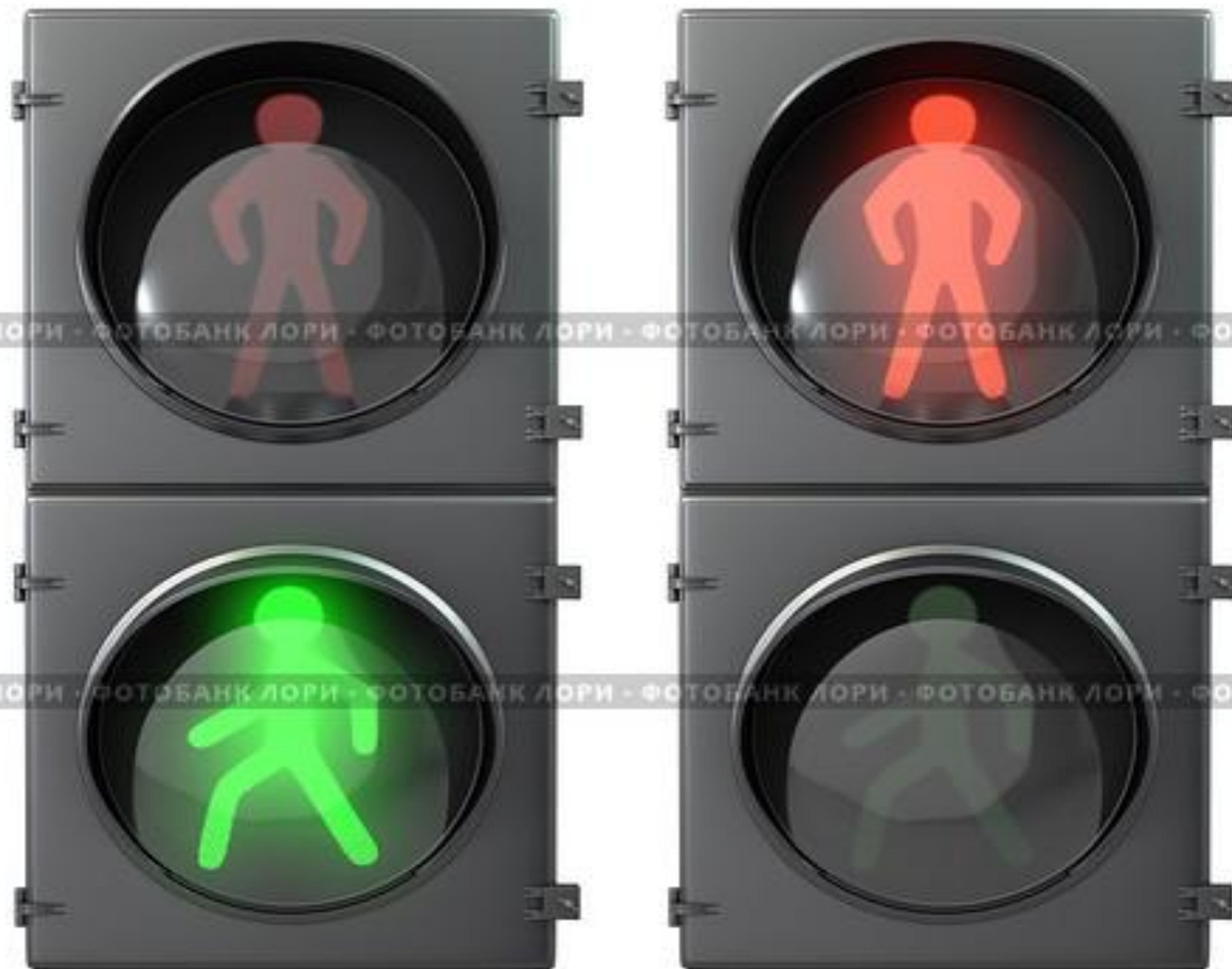
Пешеходный светофор, изолировано на белом фоне