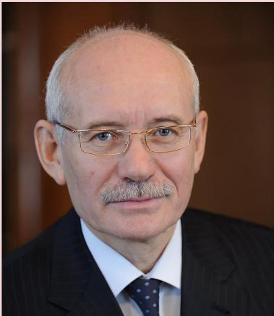
Президент РБ Хамитов Рустэм