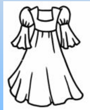
В беленькое платице