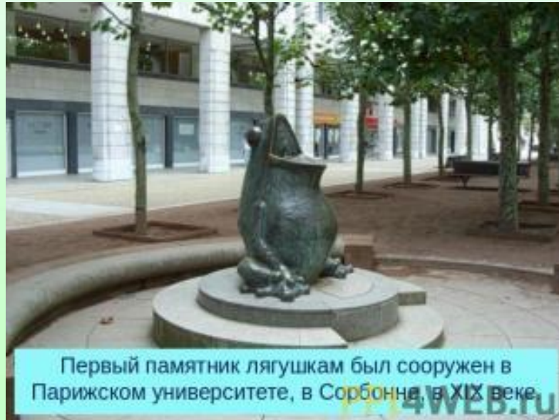
Первый памятник лягушкам был сооружен в Парижском университете, в Сорбонне, в XIX веке.