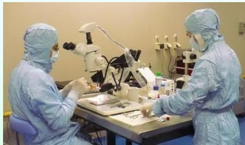
Питомник лабораторных животных