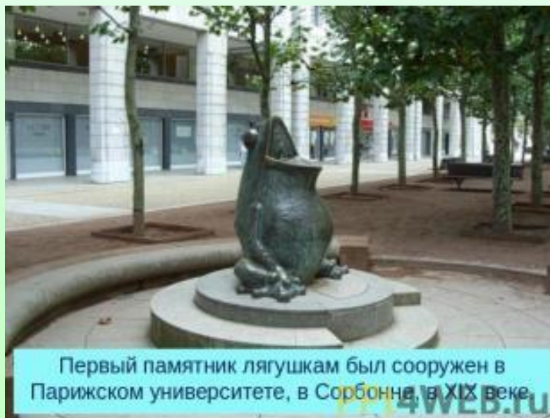
Первый памятник лягушкам был сооружен в Парижском университете, в Сорбонне, в XIX веке.